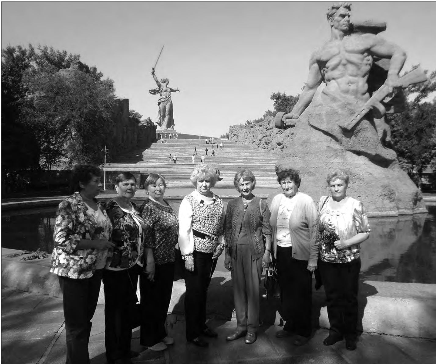
Делегаты Горнозаводского округа на Мамаевом Кургане.

С каждым годом сентябрь и октябрь становятся все насыщеннее мероприятиями для людей старшего поколения. Мне посчастливилось быть участницей выездного семинара, на котором представители ветеранских организаций обменялись опытом работы по гражданско-патриотическому воспитанию молодежи и социальной поддержке пенсионеров.