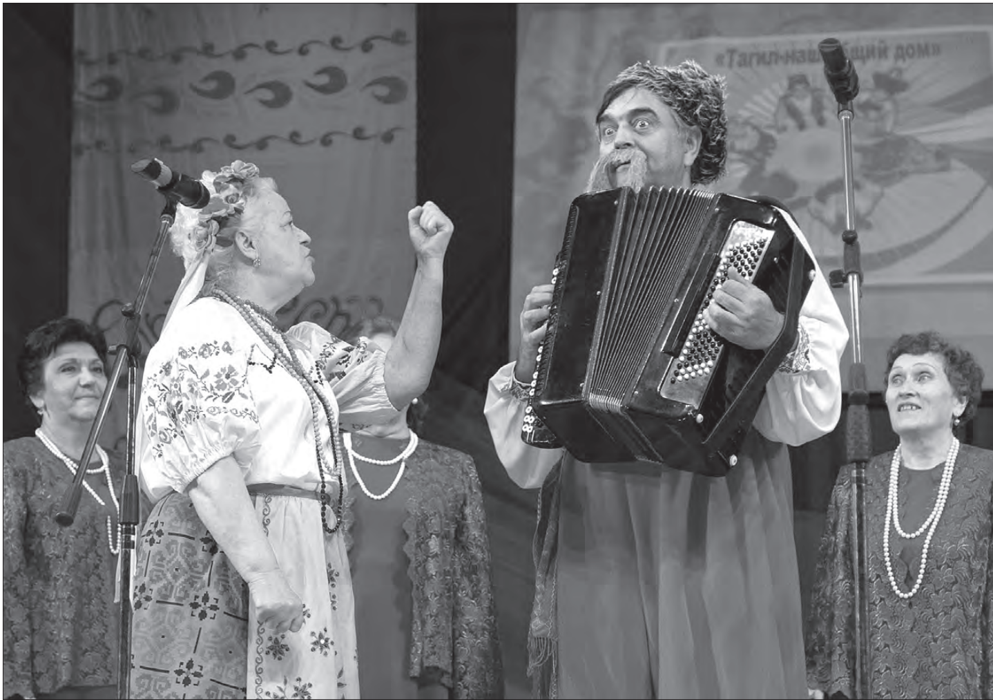
Хор ветеранов «Юбилейного» с композицией «Вареники».

Во Дворце культуры «Юбилейный» состоялся праздник «Тагил – наш общий дом», посвященный Дню народов Среднего Урала.