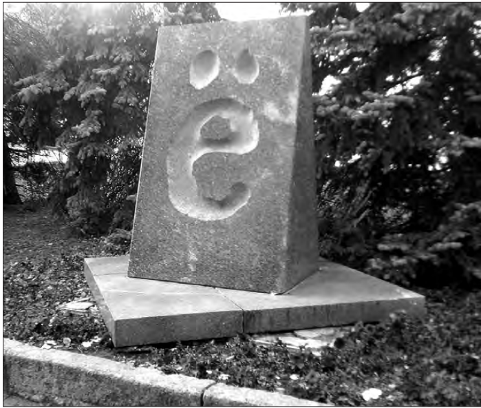
Памятник букве «ё» в Елабуге.

Н. МАКСИМОВА, ветеран труда. ФОТО АВТОРА.