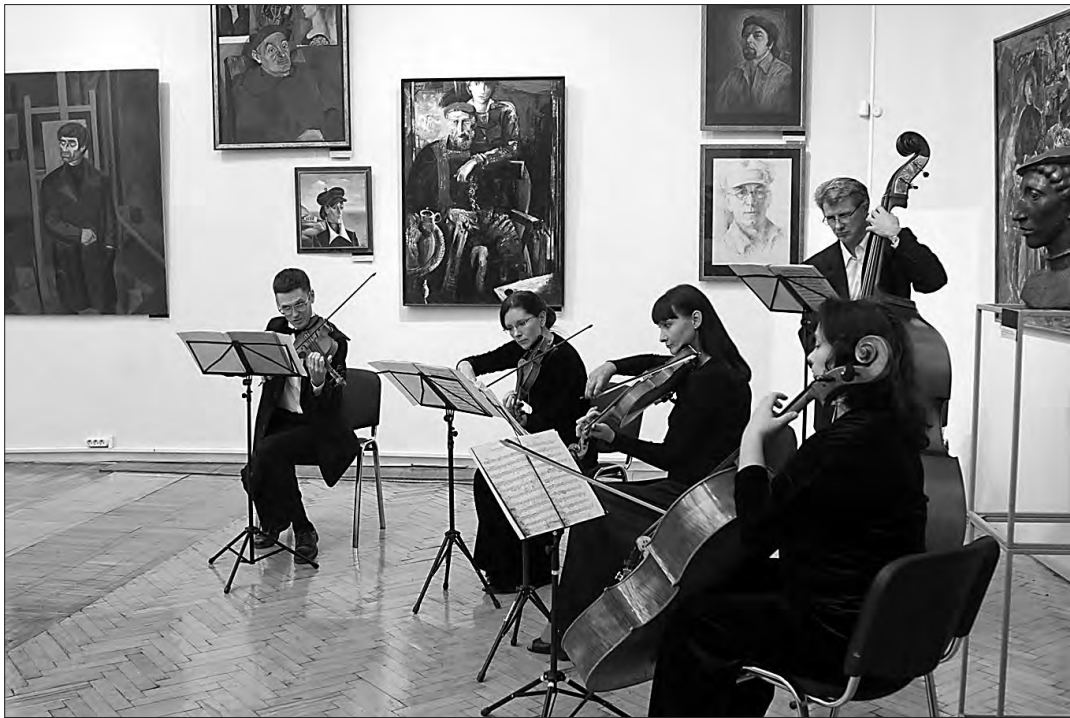
Музыкальный подарок к юбилею.

Всёобщее внимание привлек огромный пакет от Екатеринбургского музея изобразительных искусств. Музейщики из уральской столицы рассказали, что привезли своим коллегам