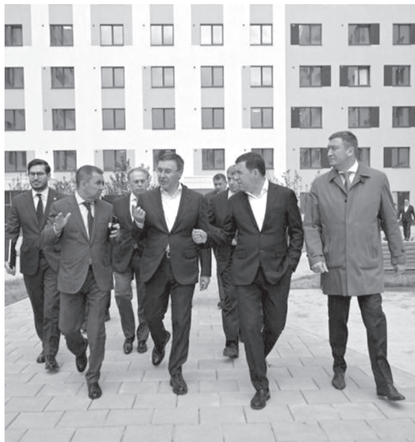
Губернатор Евгений Куйвашев с министром науки и высшего образования России Валерием Фальковым в новом кампусе УрФУ

«Формированию сопутствующей транспортной инфраструктуры мы уделяем особое внимание. Так, завершается строительство прилегающей к площадке кампуса