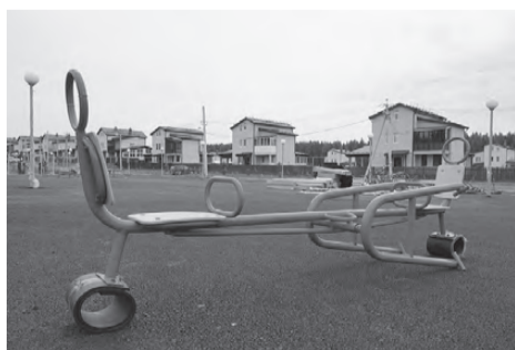
Игровой комплекс в коттеджном поселке

Проект площадки, разработанный специалистами проектно-конструкторского отдела АО «Святогор», был готов еще в прошлом году. В настоящее время он активно реализуется в жизнь. Согласно проекту, детская площадка будет включать в себя сразу несколько спортивных и игровых зон. Для юных жителей коттеджного поселка предусмотрены места