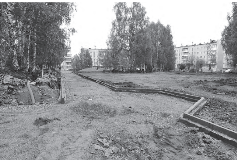
Работы ведутся в будущем «Сквере отдыха» по ул. Устинова, 92, 94

В случае положительного решения благоустройство территории победителя начнется уже весной 2024 года.