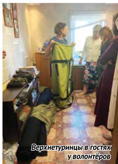
Верхнетуринцы в гостях у волонтеров

Двенадцатилетняя девочка из Нижней Туры сотнями делает маленькие открытки размером 6 на 6 сантиметров под скотчем - с одной стороны рисунок, с другой