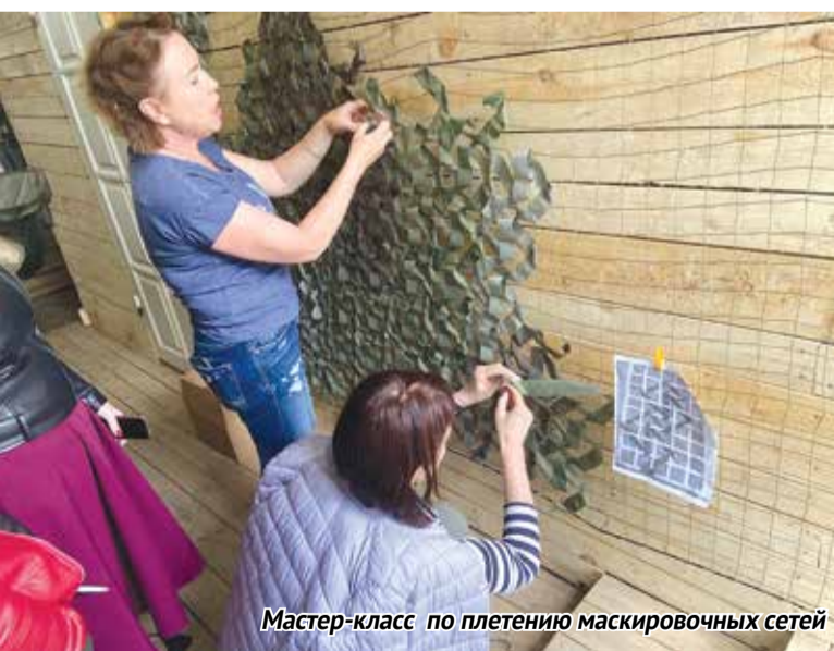
Мастер-класс по плетению маскировочных сетей

Татьяна ГРИГОРЬЕВА