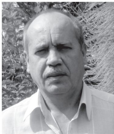
Нам жизнь дают наши родители, а свет души – учителя. Велик и славен труд учителя, на нем и держится Земля!

Школа для каждого – нечто особенное. Для кого-то это родной дом, для кого-то дружба, а некоторые в ней только учатся. Неотъемлемая часть школы – учителя и ученики. Что же значит, любимый учитель? Для кого-то любимый учитель тот, кто ставит хорошие оценки. Для другого ученика тот, кто дает хорошие знания. Учитель может развить любовь к предмету. Но и сам предмет может привить любовь к учителю. Все педагоги в нашей школе, безусловно, хороши по-своему. В каждом есть своя изюминка.