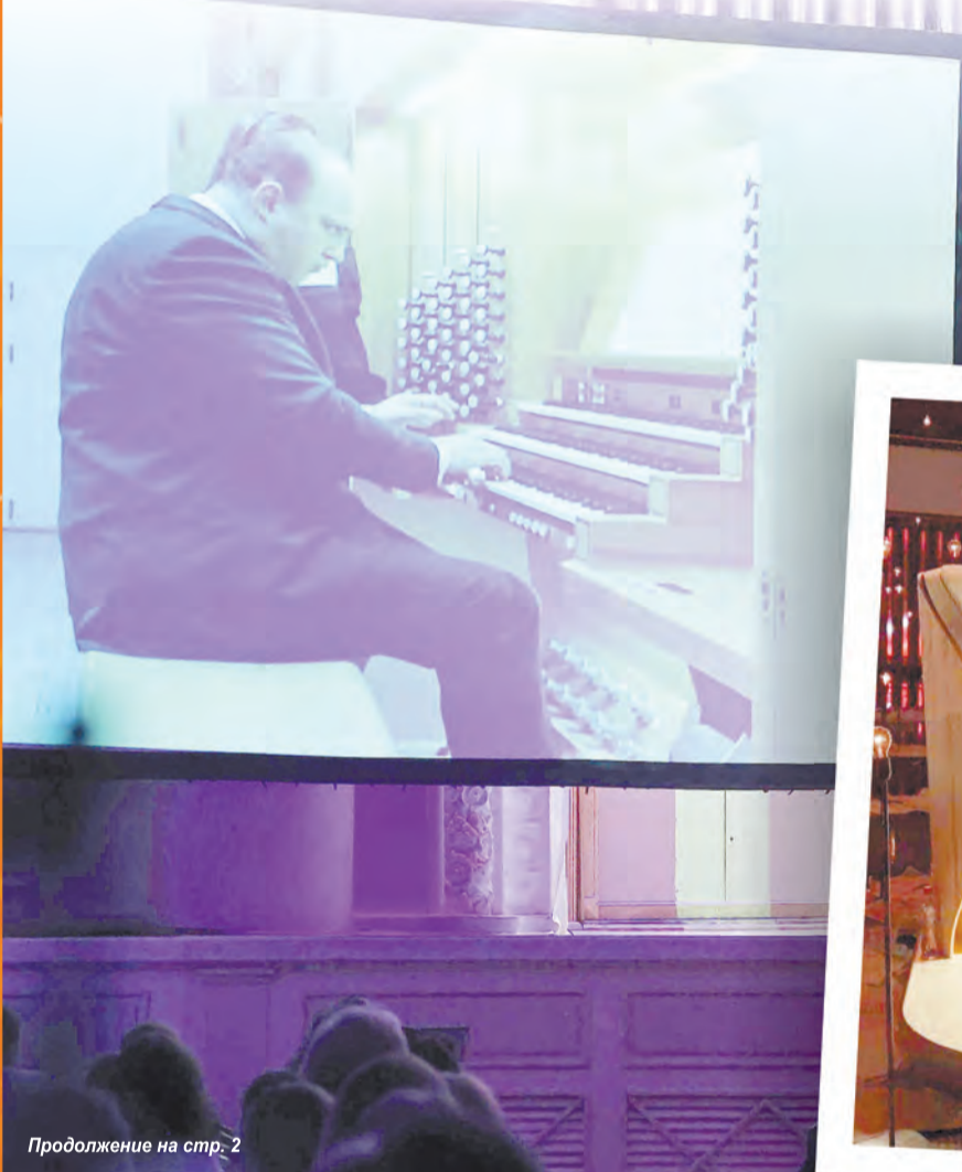
Продолжение на стр. 2