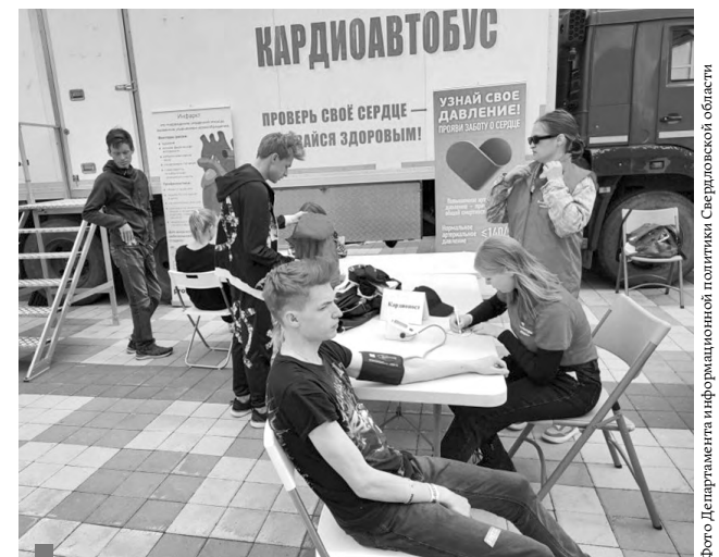
Измерение артериального давления проводят студенты-волонтеры Свердловского областного медицинского колледжа

«Рок-фестиваль «Кардиограмма» в Екатеринбурге станет пилотной площадкой в серии подобных музыкальных фестивалей по всей стране. Организаторы вместе с Центром общественного здоровья и медицинской профилактики намерены были изначально задать высокую планку, показав пример,