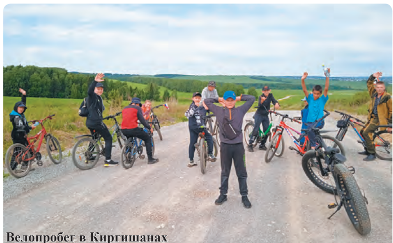
Велопробег в Киргишанах