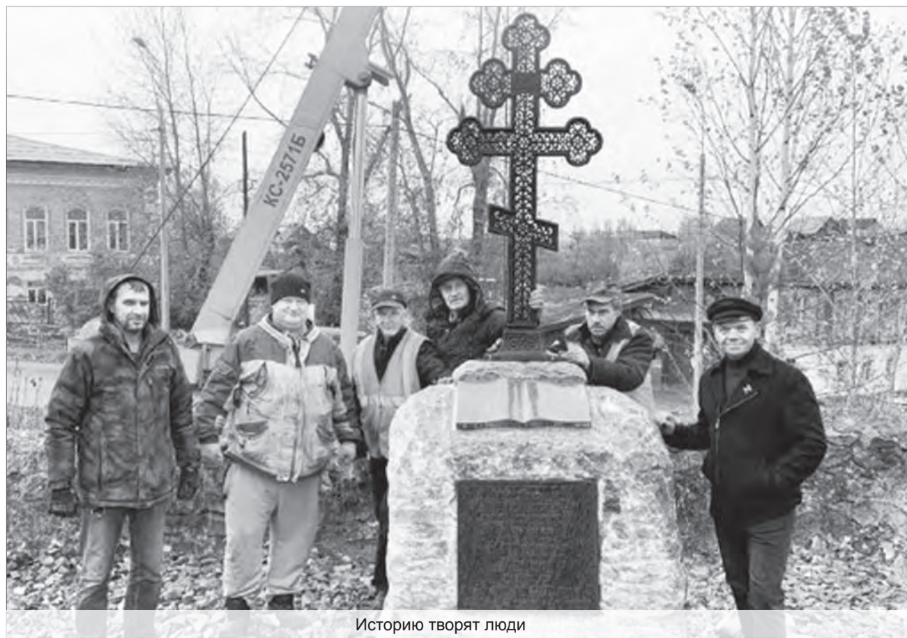
Историю творят люди