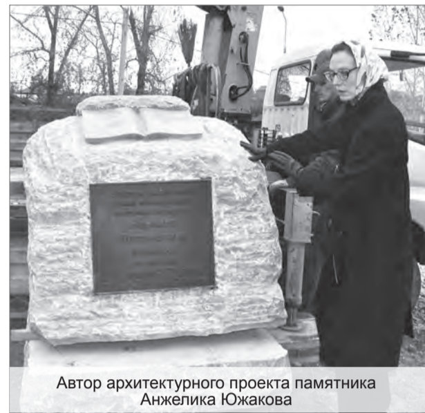
Автор архитектурного проекта памятника Анжелика Южакова

Лаконичность материала во многом определила принцип его обработки для придания эффекта скального камня, который смотрится очень естественно.