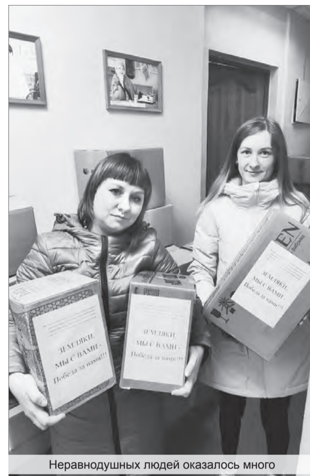
Неравнодушных людей оказалось много

Вечером 7 октября вся собранная гуманитарная помощь была загружена в автобус, который 8 октября вместе с сотрудниками редакции отправился в Елань.