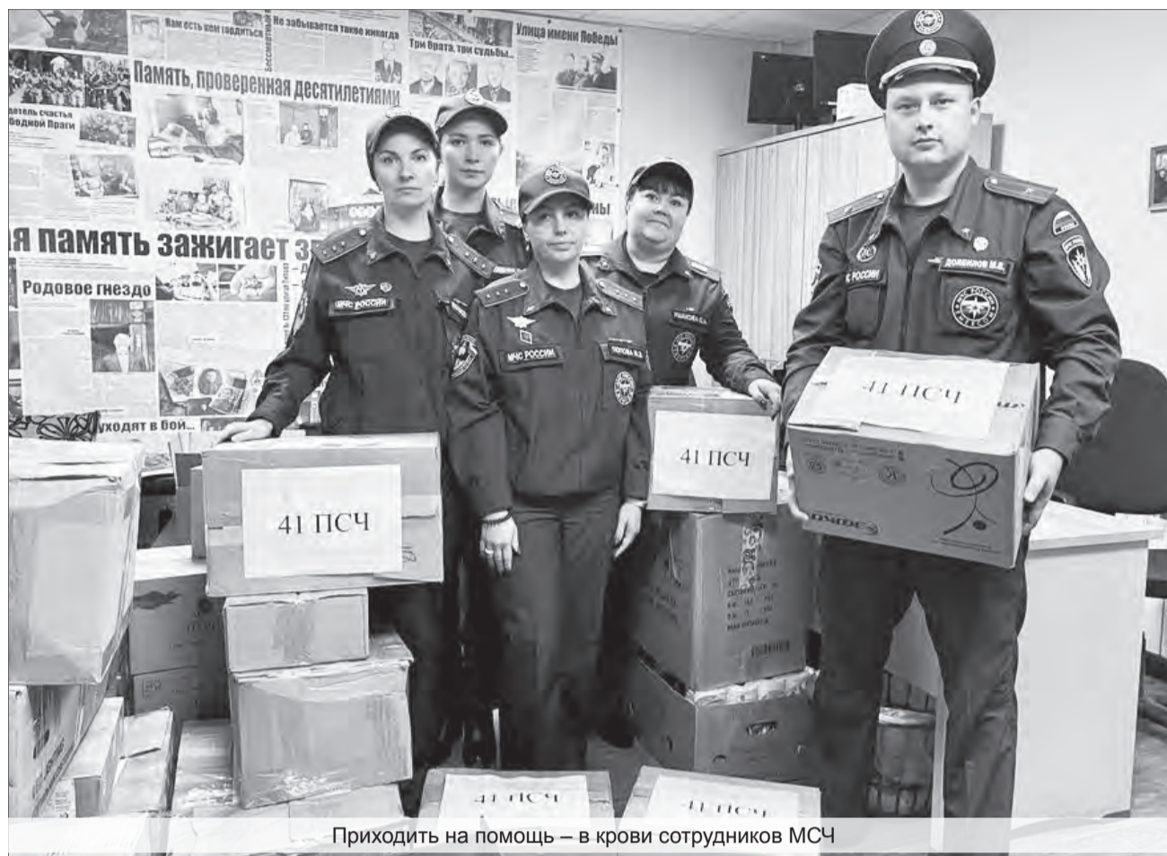
Приходить на помощь – в крови сотрудников МСЧ