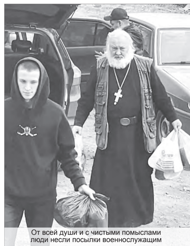
От всей души и с чистыми помыслами люди несли посылки военнослужащим

– Дела здесь у нас идут хорошо. Процесс обучения ведётся. Парни здоровые, все всё понимают, – рассказывает земляк с позывным «Чех». – Посылкам из дома очень рады, ведь они говорят о многом: нас любят, ждут, у нас есть поддержка. Вы, главное, не волнуйтесь, всё будет хорошо. Мы своё дело знаем, поставленные задачи выполним и вернёмся домой!