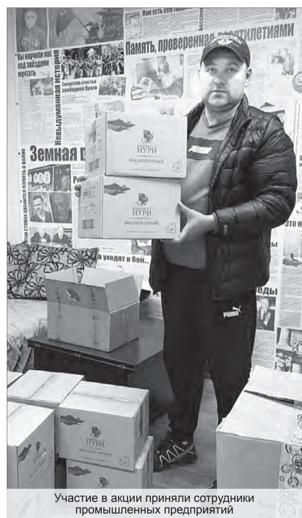
Участие в акции приняли сотрудники промышленных предприятий

Мужчины сначала заходят в автобус по очереди. Понимая, что такая схема разгрузки неэффективна, быстро и слаженно принимают решение встать в цепочку и передавать коробки друг другу. Командная работа пошла быстрее.