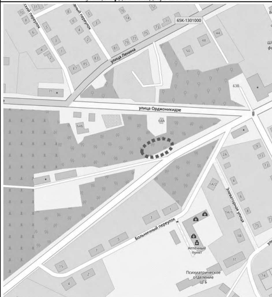
Схема расположения территории, прилегающей к главному входу городского кладбища, расположенная в границах земель общего пользования кадастрового квартала 66:44:0101013 по адресу: город Ирбит, улица Орджоникидзе, №100/2

к постановлению администрации Городского округа «город Ирбит» Свердловской области от 31.05.2023 года № 850-ПА