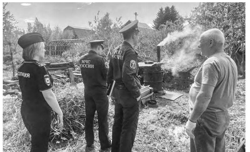
По информации департамента информационной политики Свердловской области.

НАПОМНИМ: размер административного штрафа за несоблюдение правил и дополнительных требований пожарной безопасности во время действия особого противопожарного режима может достигать 2 миллионов рублей в зависимости от степени нарушения. С начала пожароопасного периода по результатам рейдов в регионе возбуждено порядка четырёх тысяч административных дел в отношении физических и юридических лиц.