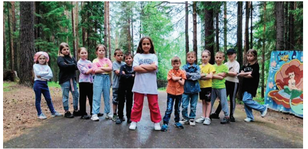
Юные красноуральцы на отдыхе в «Сосновом»

Через открытия оздоровительных учреждений в Красноуральске продолжи-