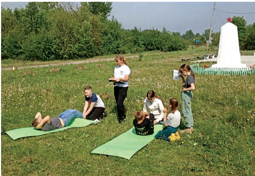
Сдача нормативов ВФСК ГТО

Площадкой для проведения тестирования поселковцев стала территория около