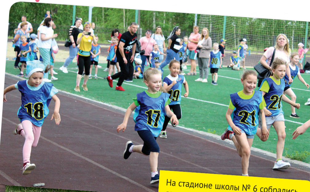
На стадионе школы № 6 собрались самые спортивные малыши нашего города, чтобы принять участие в командных соревнованиях по легкой атлетике «Энергия и спорт», организованных УФС и К. Поддержать юных атлетов пришли не только педагоги детских садов, но и родители.

Уважаемые взрослые! Давайте же сделаем так, чтобы все дети могли с улыбкой через несколько лет вспоминать годы, когда они были маленькими, когда они росли и познавали этот мир.