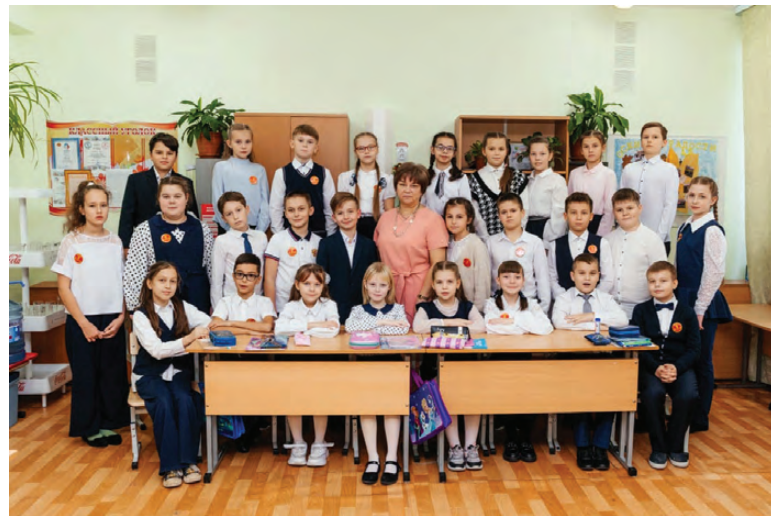
4 «А» класс школы № 8