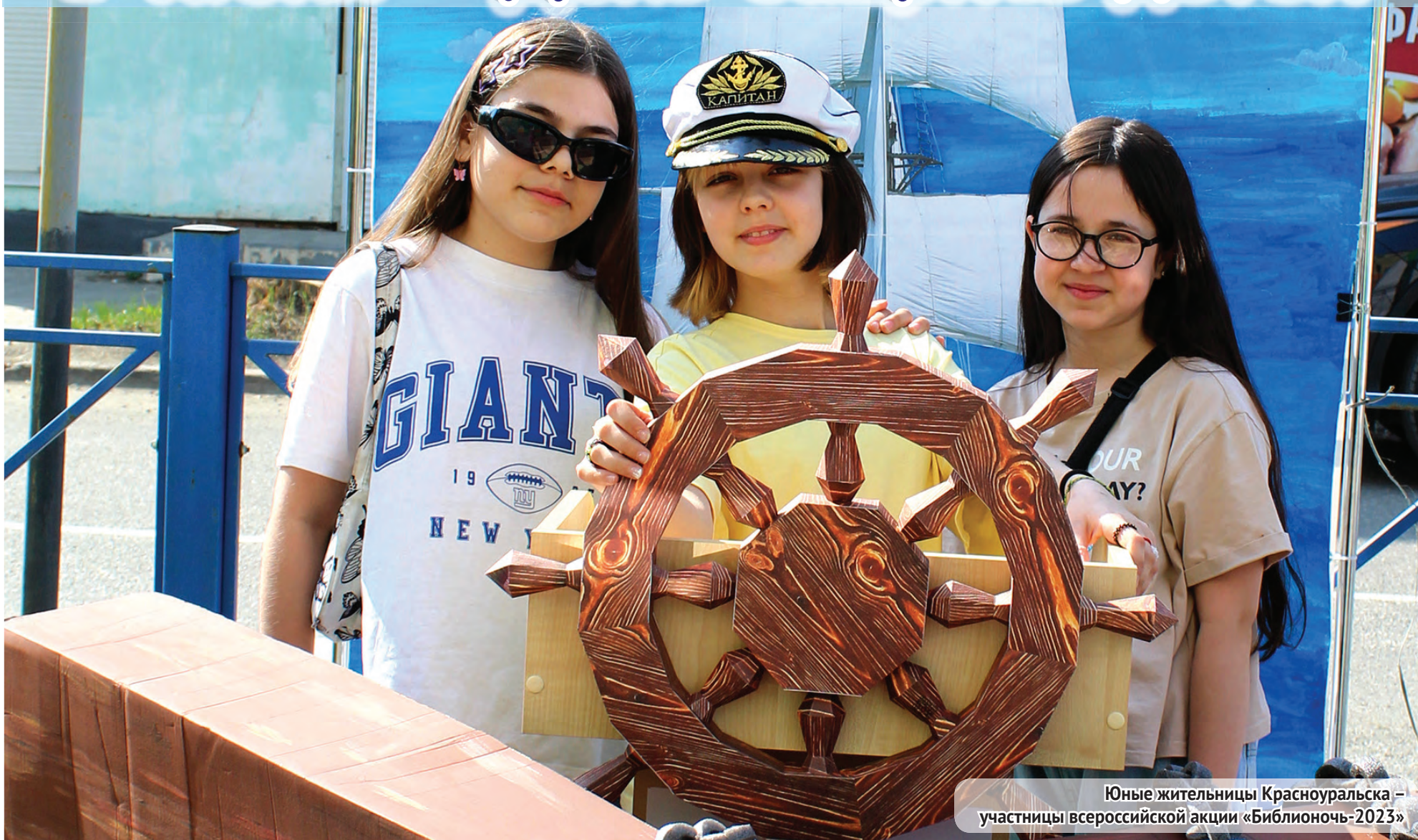
Юные жительницы Красноуральска – участницы всероссийской акции «Библионочь-2023»