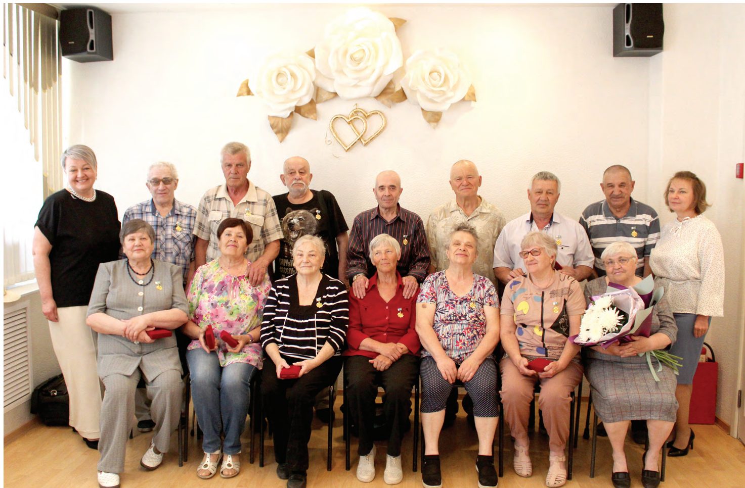
«Золотые» пары нашего города

Напомним, что знак отличия Свердловской области «Совет да любовь» является формой поощрения граждан за создание крепкой семьи, в которой были воспитаны один или несколько детей.