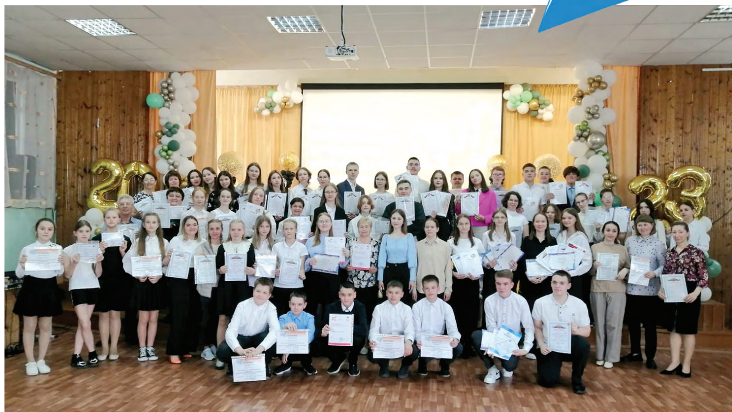
Ученики и педагоги школы № 6

Среди награжденных участники Всероссийской олимпиады школьников, международных тестовых игр «Кенгуру», «Русский медвежонок», «КИТ», международных дистанционных об-