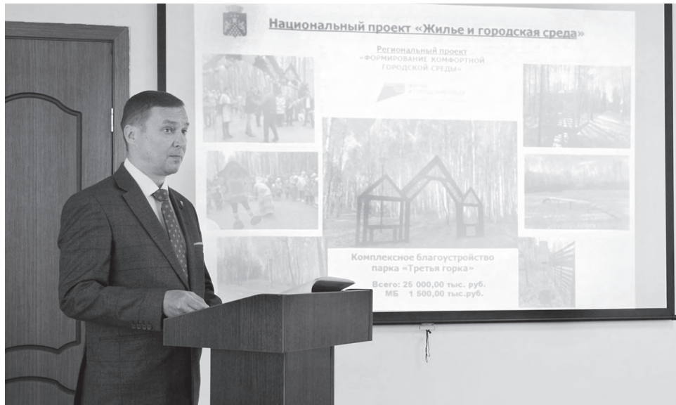
Глава ГО Красноуральск Дмитрий Николаевич Кузьминых

Что касается бюджетной политики города, в 2022 году общий объем поступлений в местный бюджет составил почти 1,5 млрд рублей, исполнение по