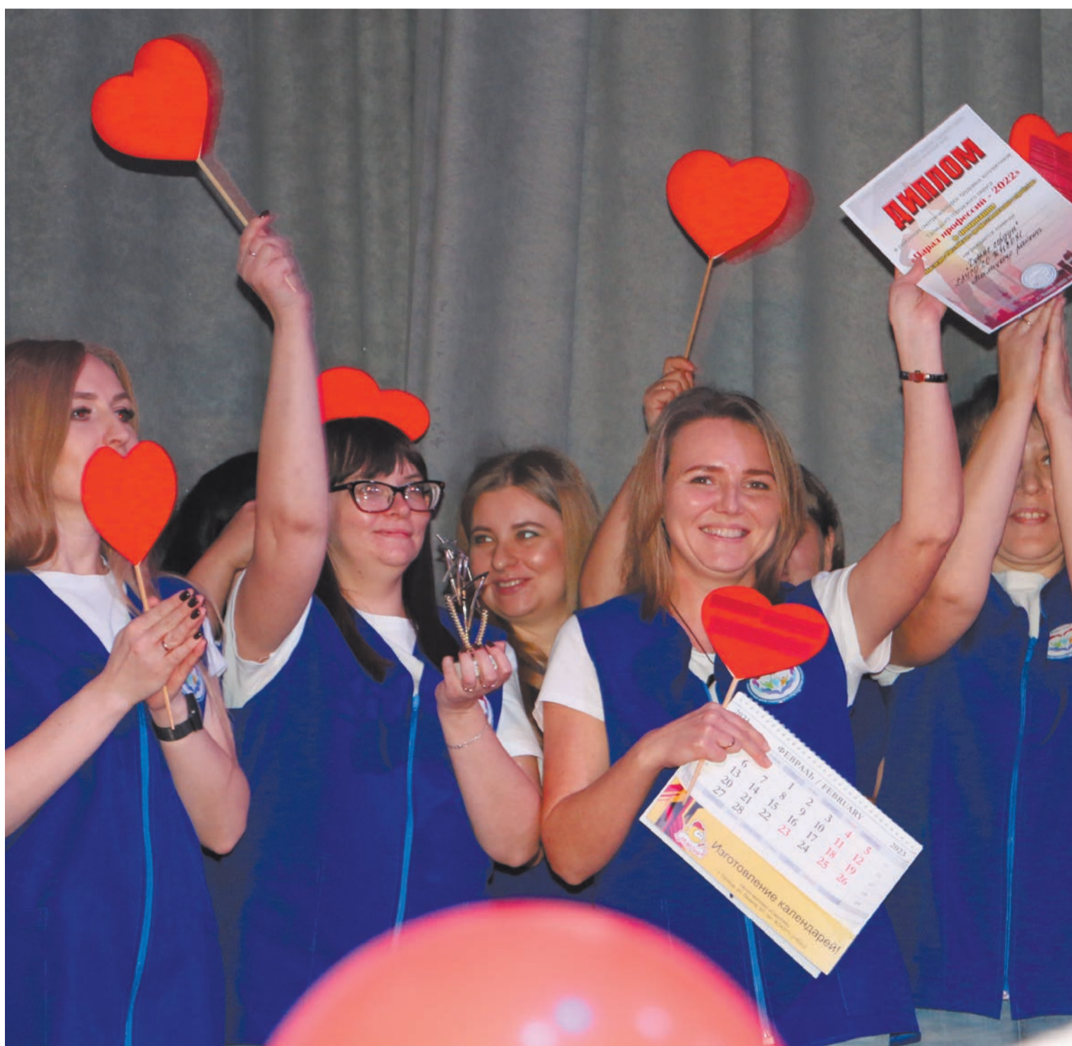
Это их профессия. Ежегодно более трёх тысяч человек нуждаются в помощи социальных работников.