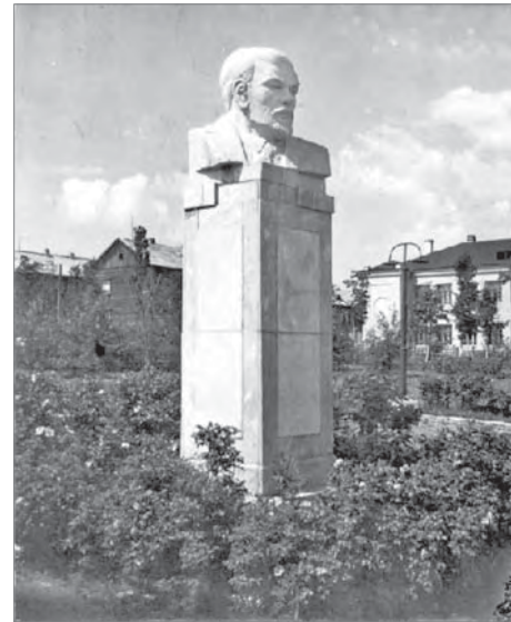
На месте Обелиска стоял бюст Ленина.