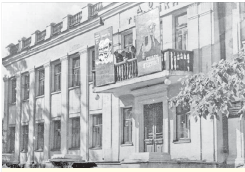
Дом техники – первое каменное здание Динаса.