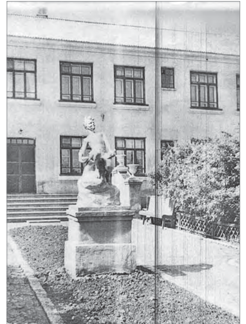
Детский сад №43, сейчас – общежитие на Ильича, 3.

Старожилы помнят, что в здании магазина «Товары для быта» изначально находилась аптека. Построено оно было перед самым началом Великой Отечественной войны. Продавались не только медикаменты, но и зубной порошок, косметика, одеколоны. Здесь же лекарства и изготавливались. Их реализовывали