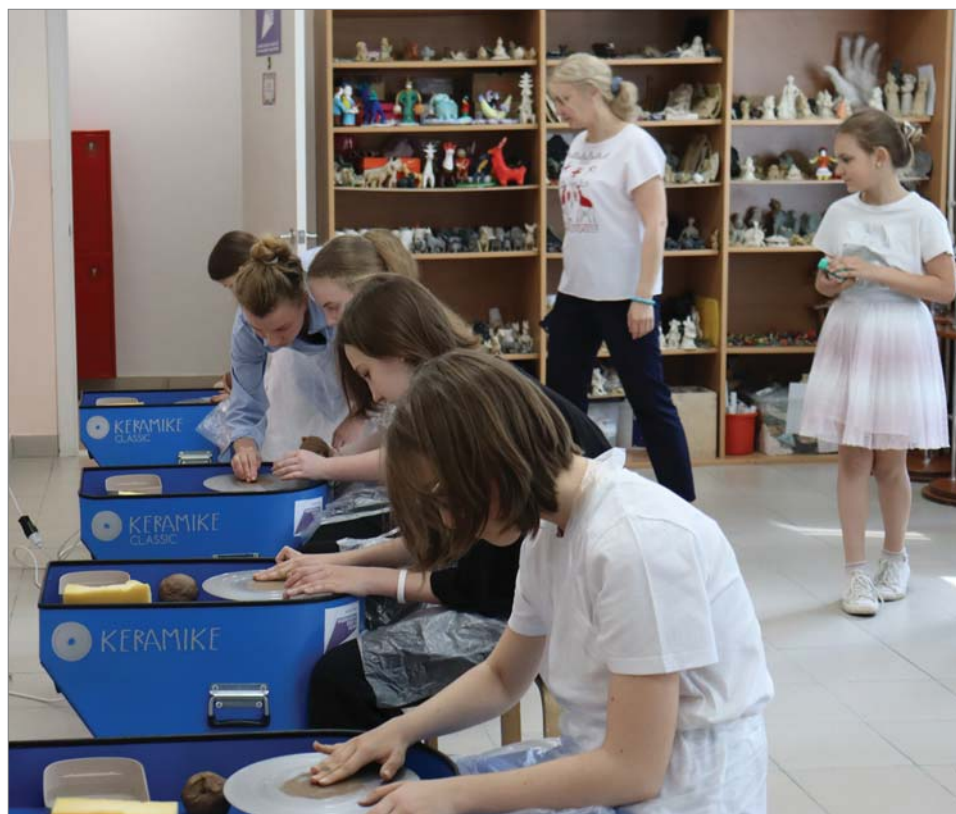
Работа за гончарным станком – сложнее, чем кажется со стороны.

В выставочном зале школы, как всегда, есть на что посмотреть. На стенах – дипломные работы выпускников, на мольбертах выставлены примеры росписи в разных техниках. Придёт время, и к ним добавится художественная керамика.