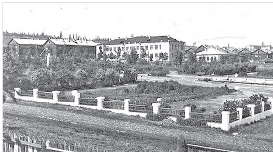
В районе сегодняшнего сквера 60-летия Победы.