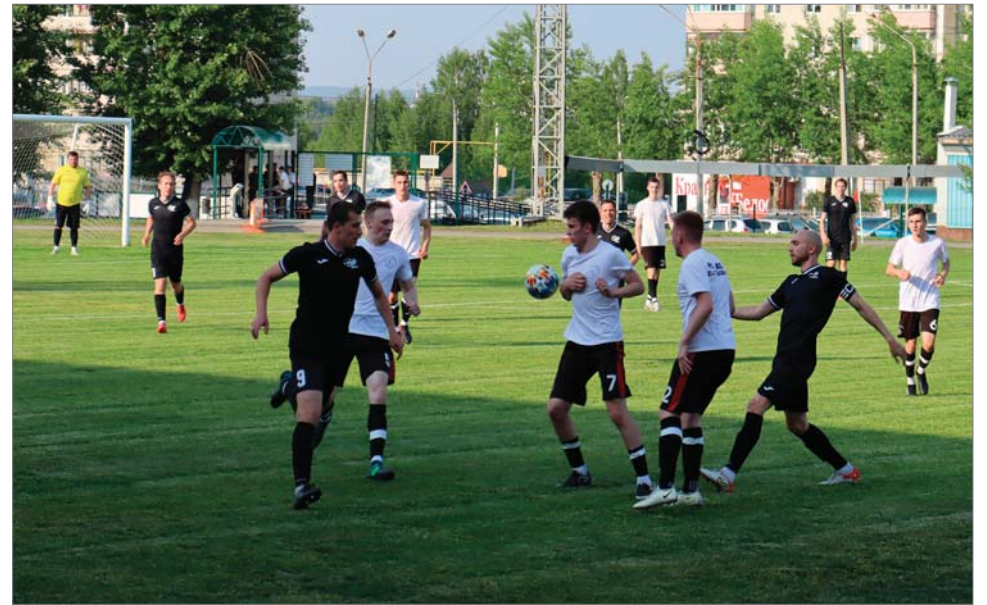
Руками не трогать!

- Очень хорошо. Хотя от тех, кто раньше играл, слышал такие отзывы – «будет «дедовщина», играть не дадут». Но я знал, что могу проявить себя и доказать тренеру, что должен выходить в стартовом составе. Так и получилось. Пока забил только один гол, но буду показывать результат, радовать болельщиков, - пообещал 19-летний игрок.