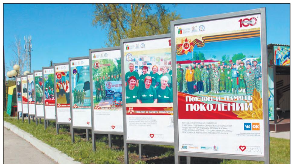
И выставка открывается!