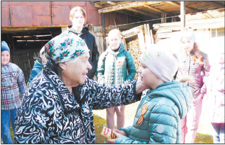
Акция «Победный май», Театральная студия «Радость»