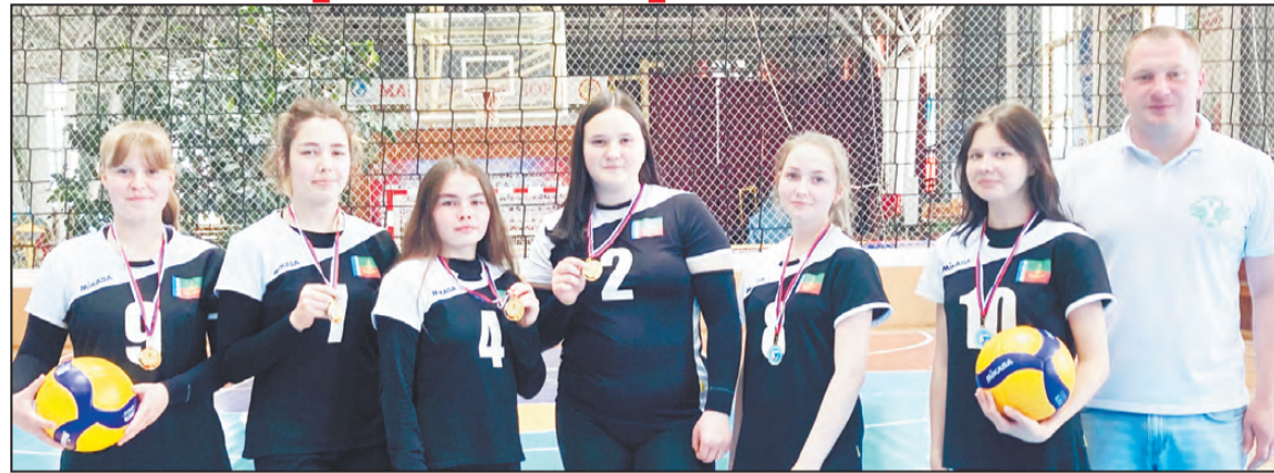
Наши волейболистки на первом месте!