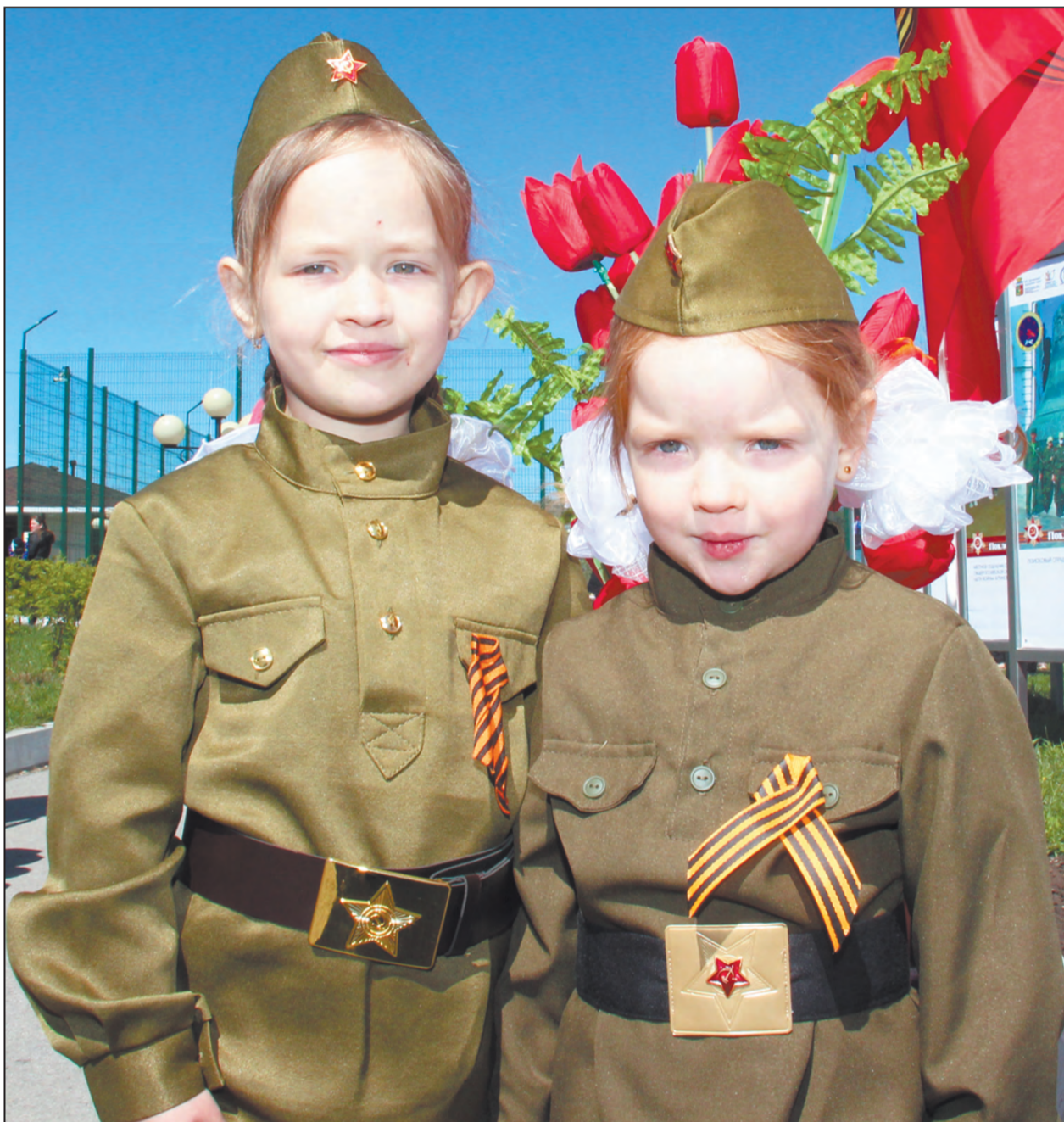
И кричит о чем-то звонко конопатая девчонка из безоблачного детства моего...

Фото Елизаветы Крючковой сделано 9 мая 2023 года