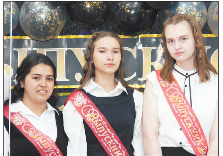
Выпускницы школы №1

Вручаются благодарственные письма родителям – помощникам классных руководителей. Передают свой творческий педагогический привет выпускникам представители династии Валиевых.