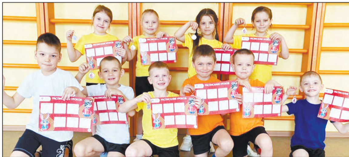
Первые нормативы ГТО сданы!

20 апреля в спортивном зале МБУ «Старт» было оживленно — воспитанники детских садов «Сказка», «Солнышко», «Капелька», «Березка» и «Радуга» прибыли для сдачи нормативов комплекса ГТО.