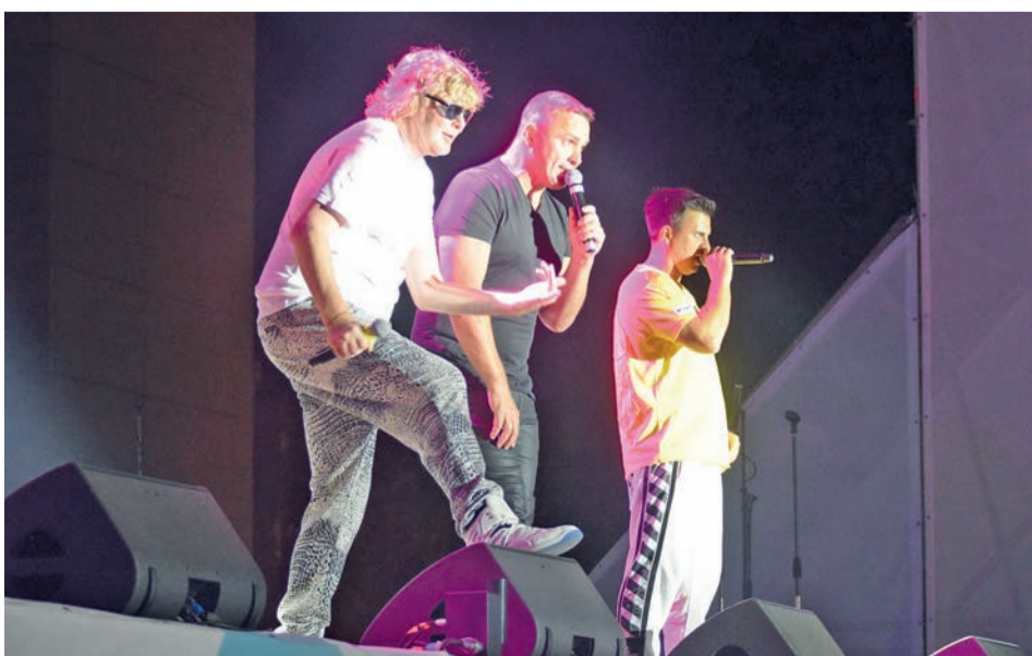
Хедлайнеры праздника – группа «Иванушки International»