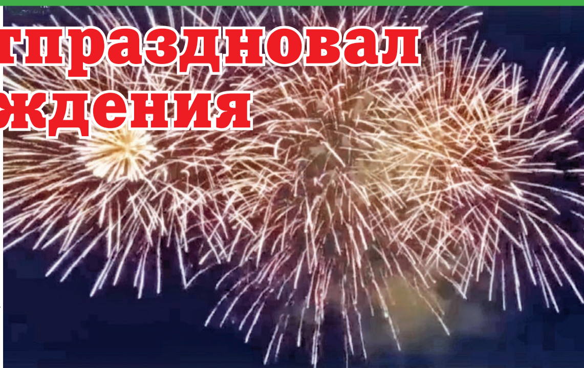
Праздник завершился красочным салютом