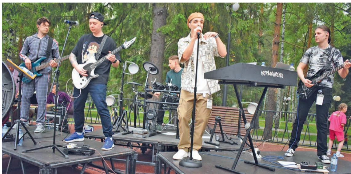
Качканарская рок-группа «Potrachenno» выступает на Сковородке