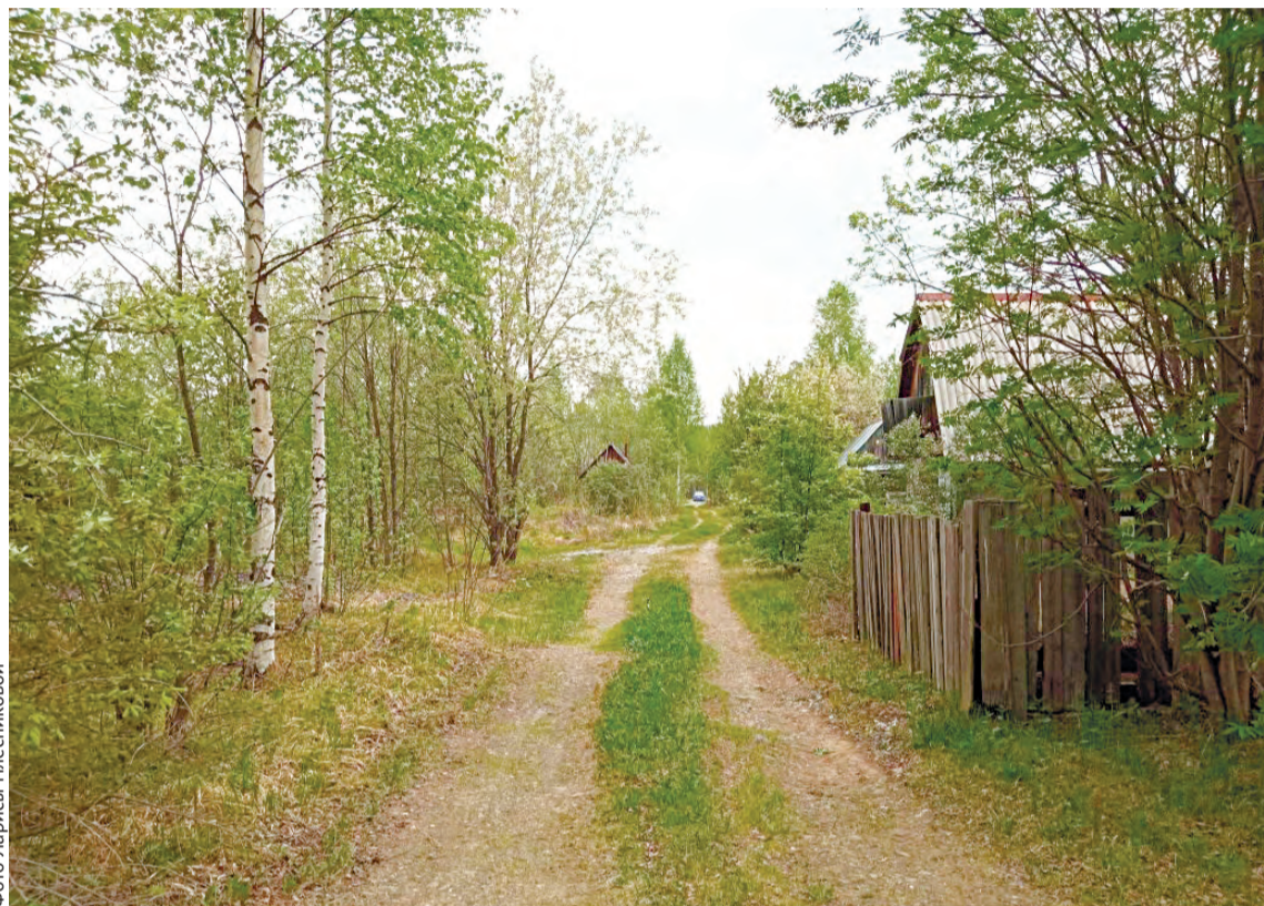
Так выглядит одна из главных улиц сада

Многие годы огороды на 39 километре терроризируют мародёры. Действуют нагло. Вечером, когда людей в садах мало, приезжают на транспорте, чаще с краном и прицепом. Никого и ничего не боятся. Эти шакалы не убивают, они просто грабят и разрушают всё. По централь-