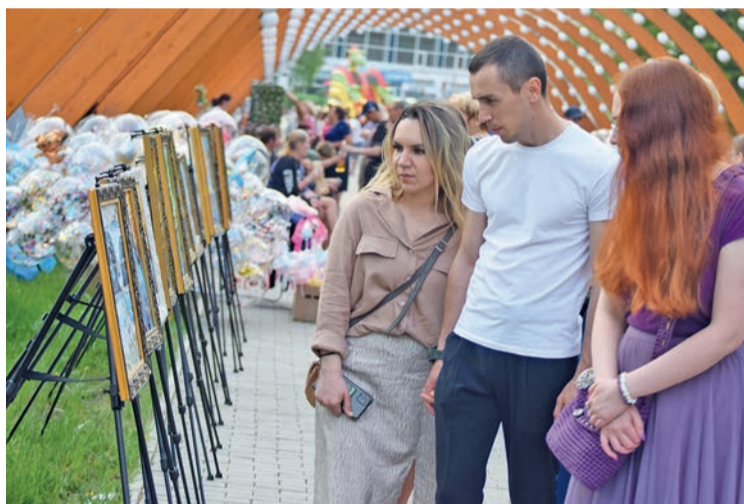
Ко Дню города была организована арт-галерея