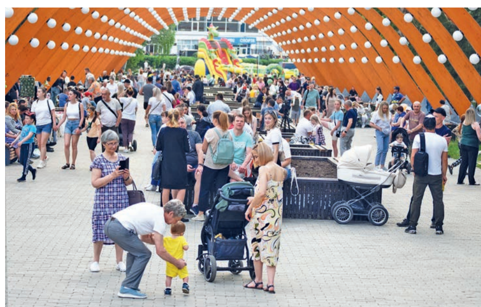
Народное гуляние под арками