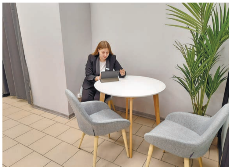
Компактный уютный офис Альфа-Банка располагает к общению

Альфа-Банк — это крупнейший частный банк, основан в 1990 году, на террито-