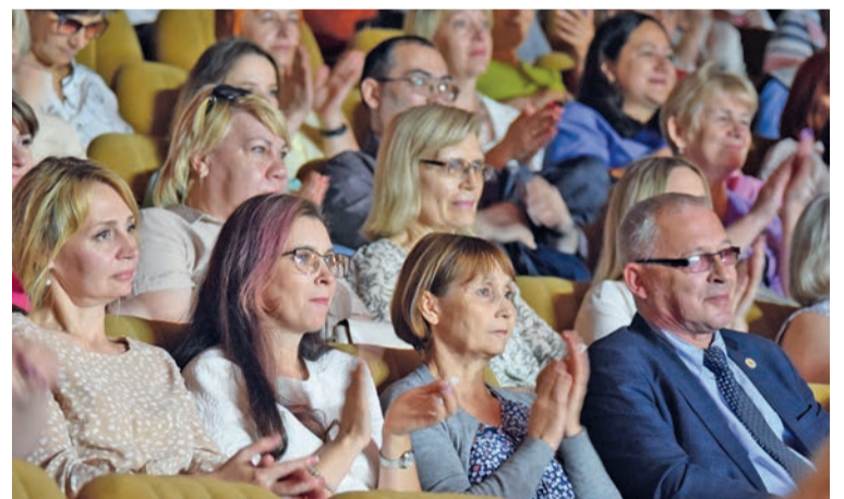
На прием главы собрали полный зал

В завершении приёма ведущий озвучил предприятия и организации, которые в этом году празднуют свой юбилей. Качканарскому ГОКу исполнится 60 лет, 55 лет ис-