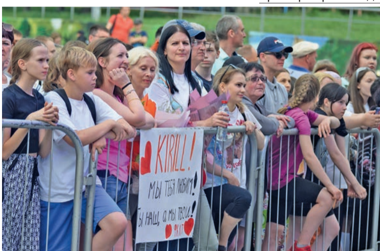
Фанатки заготовили плакат и букеты задолго до выступления «Иванушек»