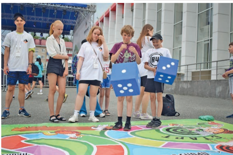
Развлечений для детей было предостаточно