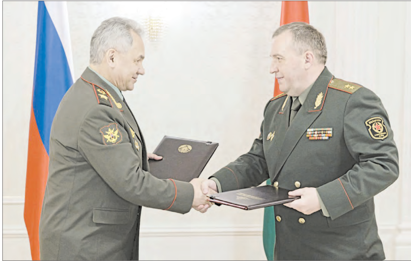
Коллективный Запад, по сути, ведёт против России и Белоруссии необъявленную войну, заявил министр обороны РФ Сергей Шойгу на встрече со своим белорусским коллегой Виктором Хрениным.

По его словам, «военная деятельность НАТО приобрела максимально агрессивную направленность». «Реализуется комплекс мероприятий по повышению боевой готовности Объединённых вооружённых сил альянса в Восточной Европе. Разворачиваются дополнительные воинские контингенты и военная инфраструктура, активизируется учебно-боевая и разведывательная деятельность вблизи границ Союзного государства», – подчеркнул глава военного ведомства.