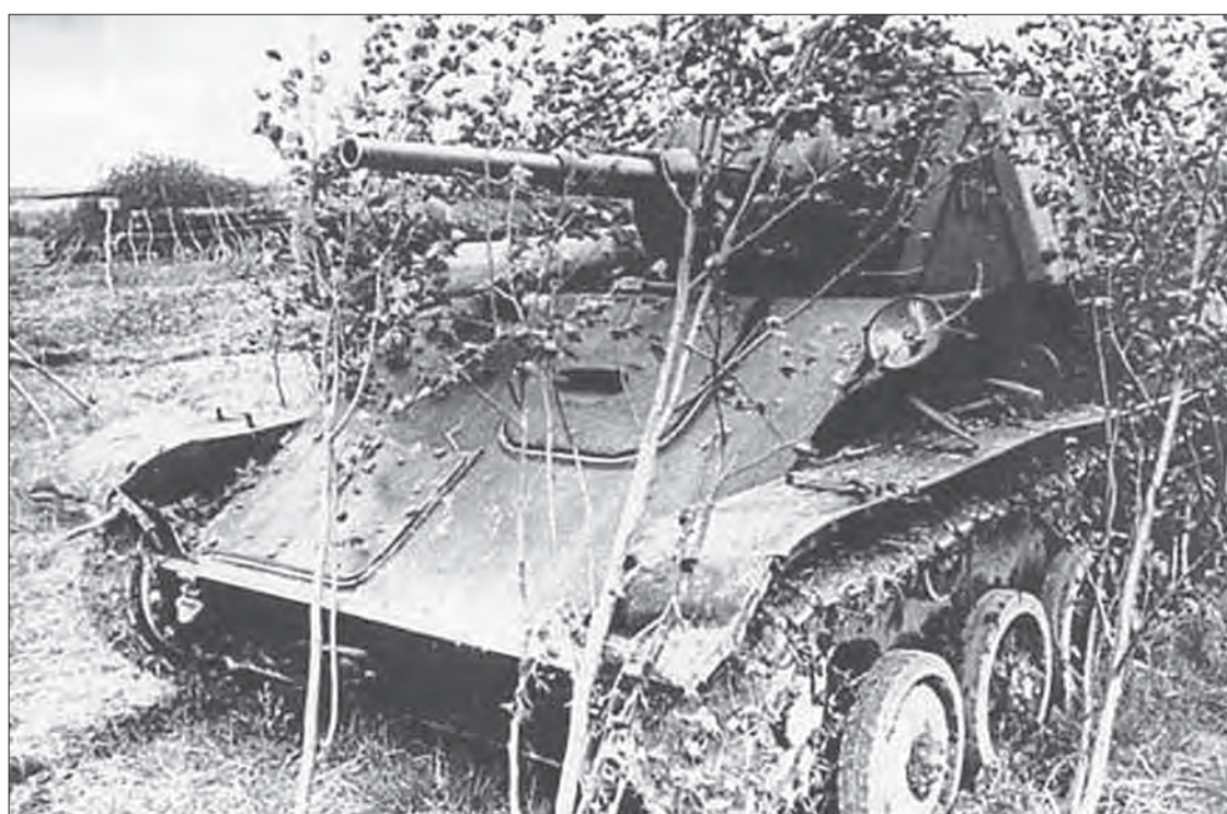
Танковая бригада выполняла задачу по развитию прорыва в направлении Дубно, Загорья и далее на запад.

Двигаясь от Дубно на Загорье, командир бригады получил сведения, что с востока на Каширино направляется танковая и моторизованная колонна противника. Для разгрома колонны противника, выходящей в тыл бригады, было решено танковой ротой, усиленной ротой автоматчиков и отделением сапёров, организовать засаду у моста через реку, пересекающую дорогу Каширино – Загорье.