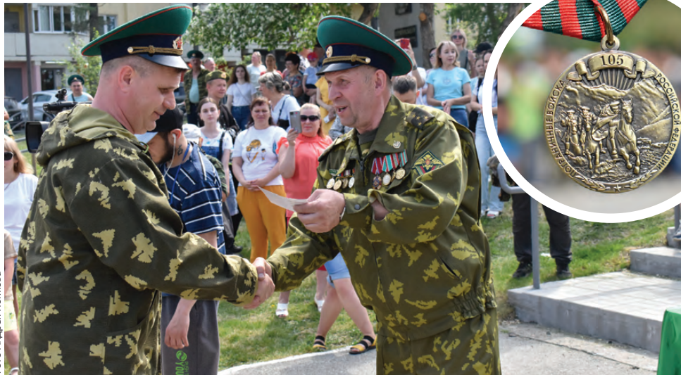
Награда – за верность присяге и границе

Первоуральским пограничникам в торжественной обстановке вручили юбилейные медали «105 лет пограничным войскам».