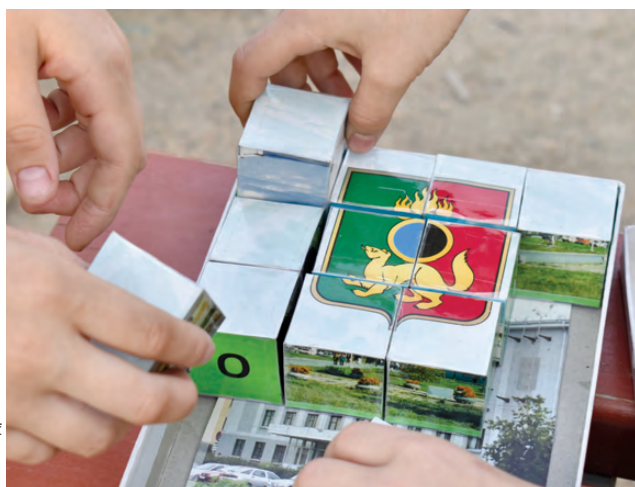
Школьники собирали символику города