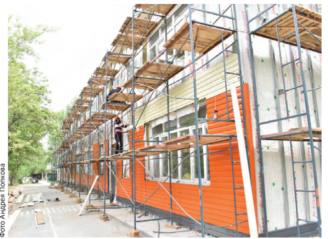
Проверка объектов капремонта — постоянная практика