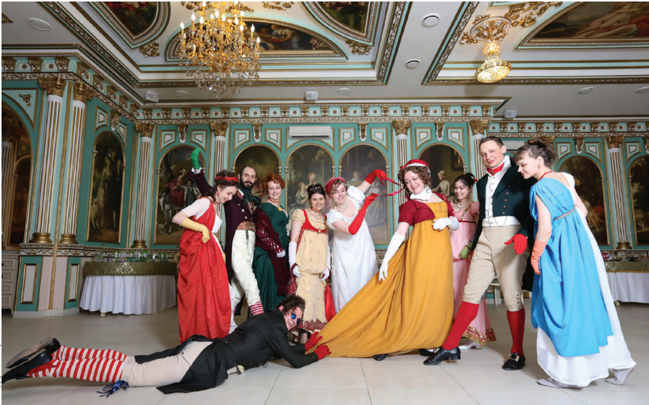
Инкруаябли и мервейезы в исполнении клуба исторического танца «Pas de Cote». Гранд-бал «Лихие 90-е (1790)»

Выбор варианта зависит от того времени, который хотите повторить. Возьмем, пожалуй, XIX век, он больше на слуху, а конкретнее три десятилетия – 1840, 1850 и 1860.