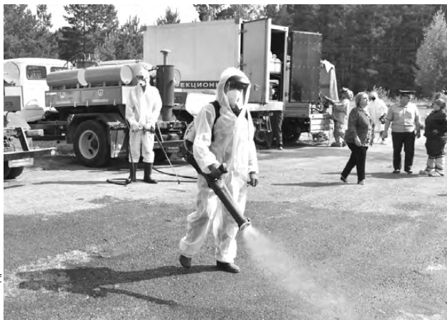
Мощность распылителя — 12 литров в минуту

В целом учения прошли успешно. — Было показано место эпидемиологического очага, место отбора проб, место проведения дезинфекции и место уничтожения трупов павших живот-