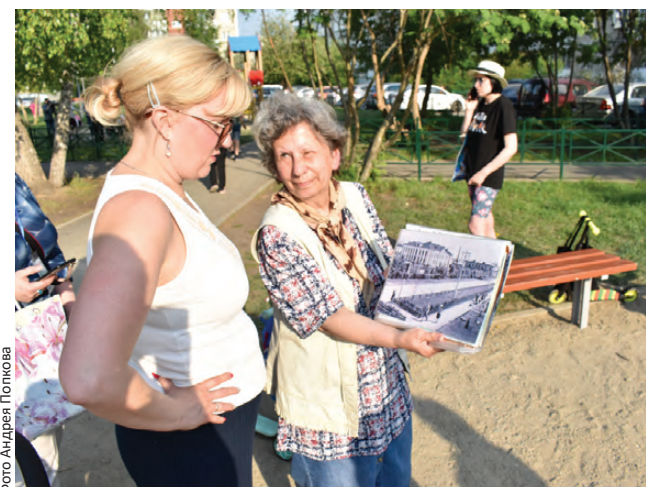
Взрослые угадывали по фото знаковые места старого Первоуральска