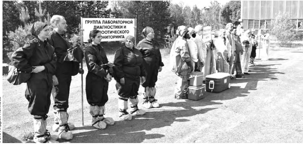
Борцы с птичьим гриппом: построение

В Первоуральске ликвидировали очаг высокопатогенного гриппа птиц, который опасен и для человека. Благо, это были только областные учения различных служб: по легенде вспышка опасного вируса поразила кур-несушек одного из хозяйств в частном секторе.