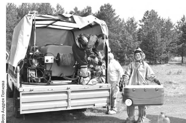
Выгружаем герметичные контейнеры

У больной птицы наблюдается малоподвижность, отек подкожной клетчатки головы и шеи, слизистые истечение из носа, чихание, хрипы, одышка, взъерошенность оперения, потеря чувствительности, синюшность сережек и гребня, диарея, снижается качество скорлупы несенных яиц. Птица впадает в коматозное состояние и через 24-72 часа гибнет. Гибель птицы может достигать 70-80%. Владелец частных хозяйств при данных симптомах у птицы следует обратиться за помощью в ветеринарную службу.