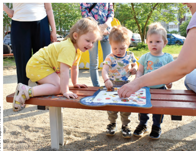
Самые маленькие украшали торт