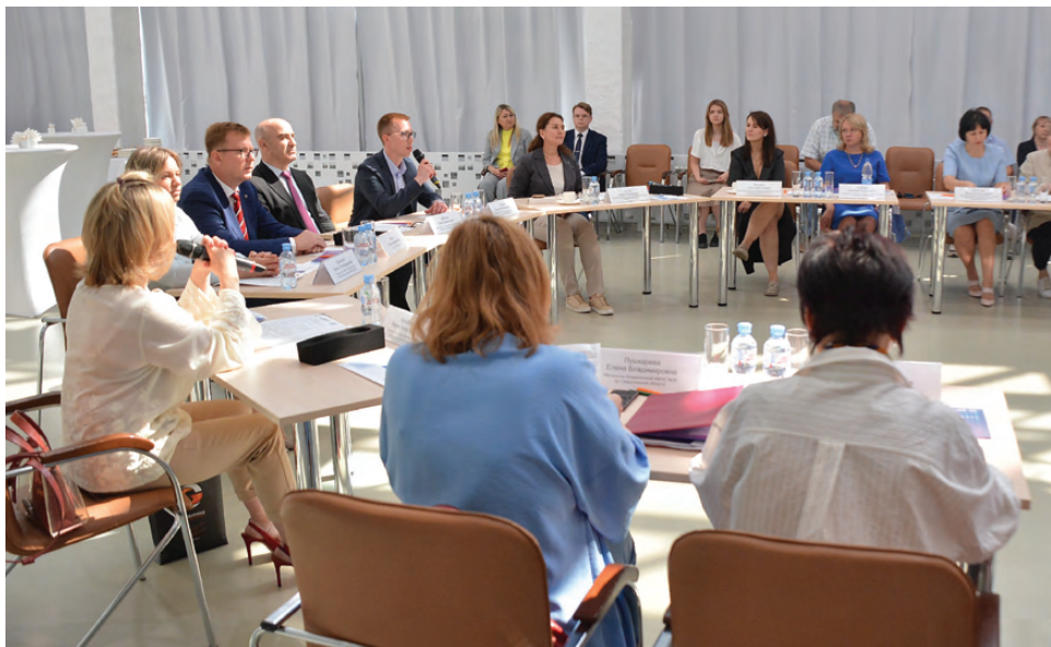
За одним столом собрались представители власти и бизнеса

Среди награжденных также были представители малого и среднего бизнеса Крас-