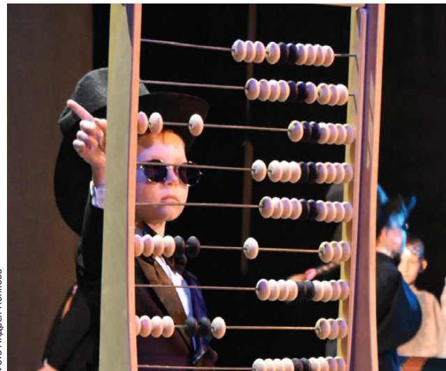
«Все посчитаем, всех учтем!»

– Такие фестивали в первую очередь нужны нашим