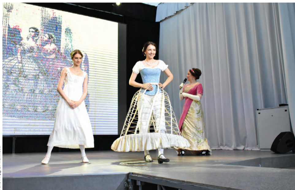
Какое красивое разоблачение дамы!

Вообще, не будет преувеличением сказать, что в День красоты и гостеприимства-2023 ведущей темой была одежда. Эта часть программы включала интересные лекции, дефиле, мастер-класс, более того, пу-