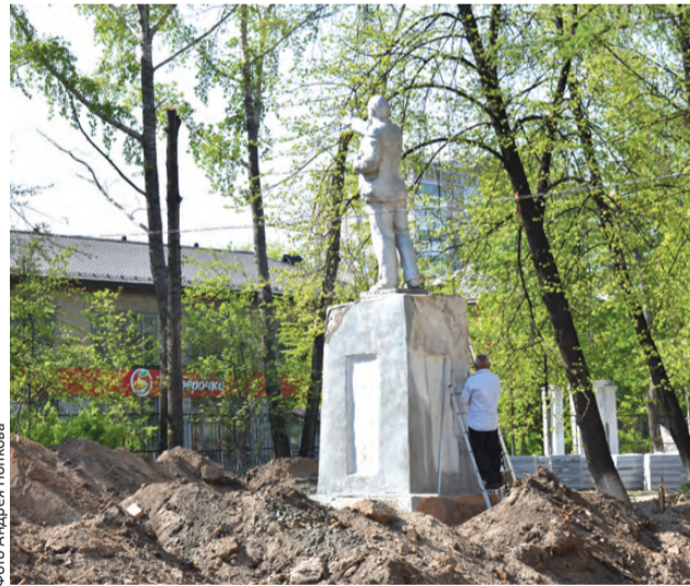
Памятник Ленину тоже приведут в порядок

Ждет гостей парка и еще одно необычное решение: рядом с театром «Вариант» появится площадка уличных всепогодных музыкальных инструментов, которые будут