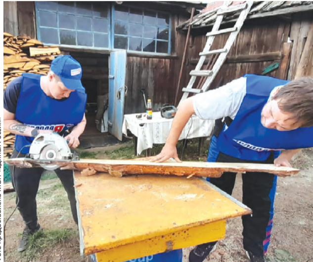
«Молодая Гвардия» привела в порядок крыльцо дома, заменила пол