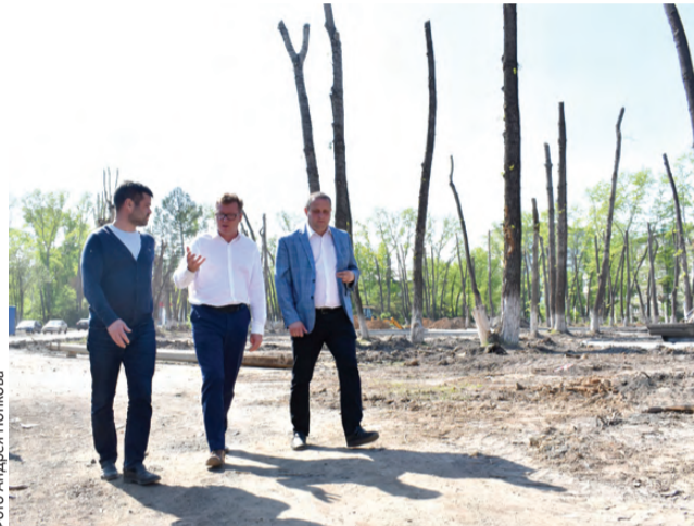
Вместе с подрядчиком Игорь Кабец осматривает территорию стройки

Полным ходом идет масштабная реконструкция парка возле театра драмы «Вариант» в микрорайоне Хромпик. С первых дней работы – под пристальным контролем городской администрации. На прошлой неделе в очередной раз оценил качество и темпы строительства глава Первоуральска Игорь Кабец.