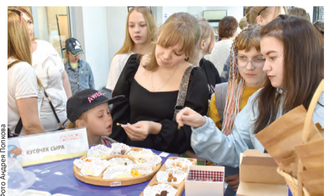
Настоящему гурману достаточно небольшого кусочка