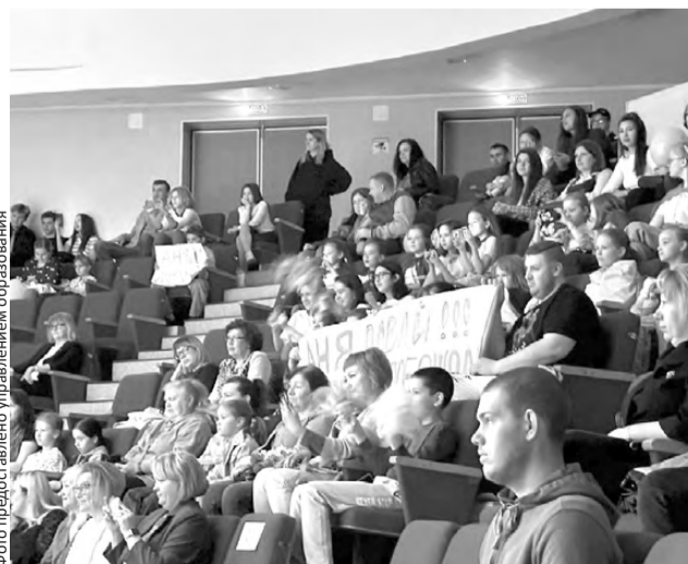
У конкурсантов уже есть свои группы поддержки