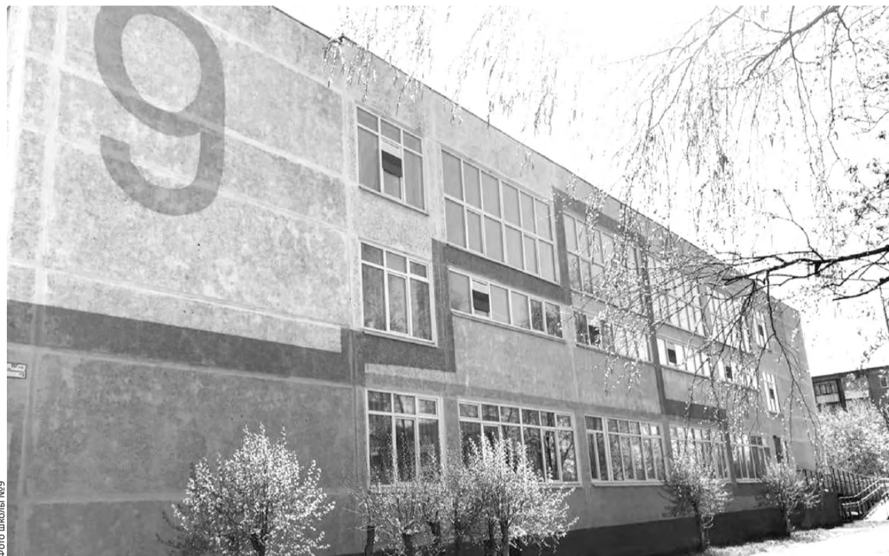
Фото школы №9

В 2019 году в школе №9 в рамках проекта «Уральская инженерная школа» начали функционировать два кабинета технологии, где реализуется образовательная программа по данной дисциплине, с учетом специфики содержания учебного процесса по гендерному признаку. Динамичное развитие современной системы образования, появление инновационных подходов и приемов относительно учебного процесса,