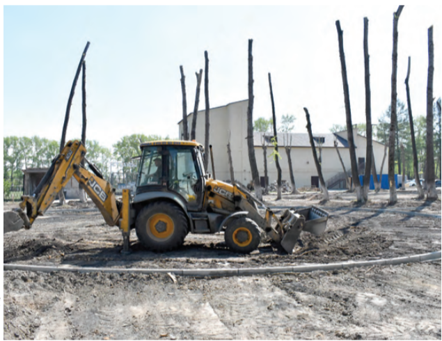
Кронирование завершено, площадки готовят к укладке плитки и асфальта