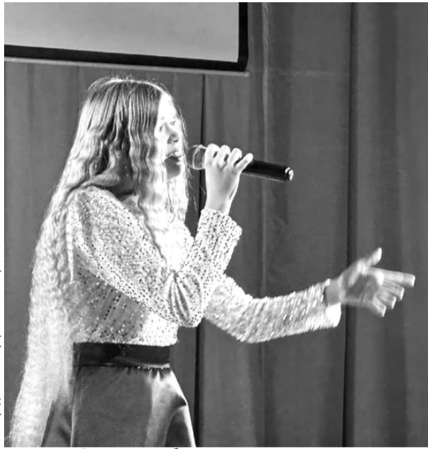
Воплощение образа так же значимо, как и знание языка