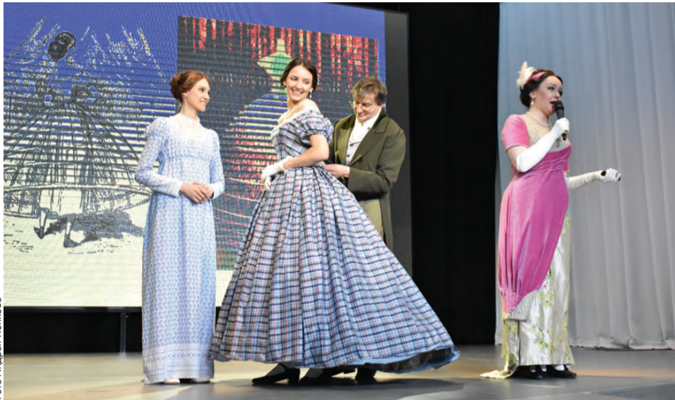
Мода прошлых веков на одной сцене

Судя по ажиотажу, интересно было всем. Из интереснейших отметим, что на Дне красоты и гостеприимства можно было получить кон-