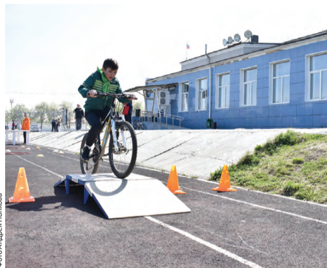
С навыком фигурного вождения легко преодолеть препятствия

— Дорогие ребята, я рад приветствовать вас, юных инспекторов безопасности