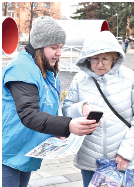
Центр города стал центром голосования за проекты благоустройства

Волонтеры проекта «Формирование комфортной городской среды» работают в Первоуральске и СТУ уже третью неделю. Они напоминают жителям про ценность каждого голоса при выборе объектов благоустройства-2024, наглядно рассказывают о проектах, отвечают на вопросы и помогают проголосовать. Одна из площадок, где можно найти волонтеров – площадь Победы. «Вечерка» побывала там в минувшую пятницу.