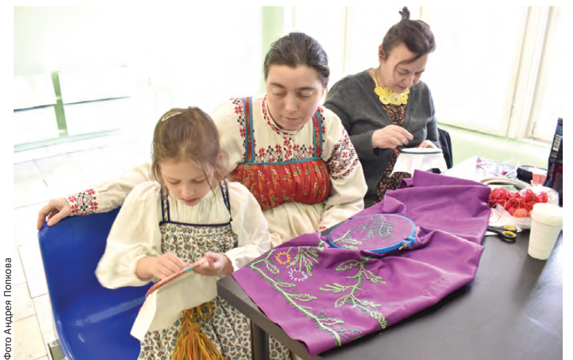
Стежок к стежку... «Какие у меня понятливые ученицы!»

лям, и участникам. Среди них всегда много молодежи.