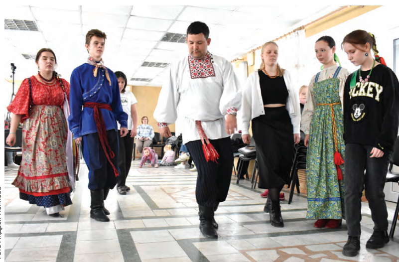
Когда каждое движение – со значением