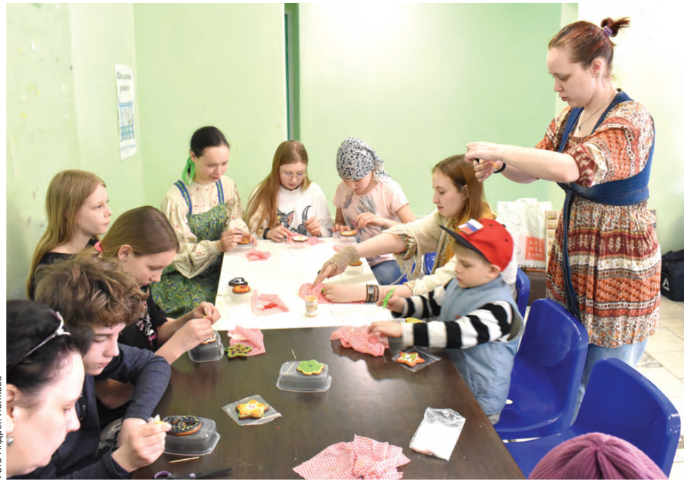
На вкусном мастер-классе «Стороны»

сто как об «исполнителе», а как о просветителе. Так, за свою историю гостями Первоуральска были нагайбаки – этнорелигиозная группа, проживающая в основном в Нагайбакском районе Челябинской области, нагабайком, к слову, был Александр Васильевич Суворов. Обязательно упомянем и липован – русских старообрядцев, проживающих в Румынии. Не говоря уже о корифеях, как тот же ансамбль «Братина», изучающих гребенскую и терскую традиции. К их числу можно отнести и фольклорный ансамбль «Перегода» из Оренбурга, это постоянный участник фестиваля. Далее, программа включает наряду с концертом мастер-классы. Самое же ценное, что фестиваль интересен – и слушате-