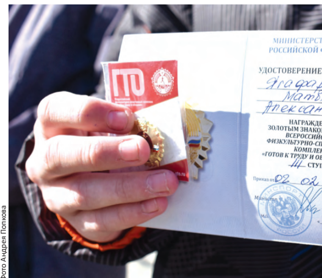
По новым нормам получить знак «ГТО» стало легче

Во второй половине апреля первоуральские школьники в массовом порядке сдавали нормативы ВФСК «ГТО» по плаванию. Они последовали примеру студентов ПМК, которые первыми вышли на водные дорожки. А ГТО-апрель скоро завершат представители всех возрастов, в том числе и старшего поколения, – стрельбой из пневматической винтовки.