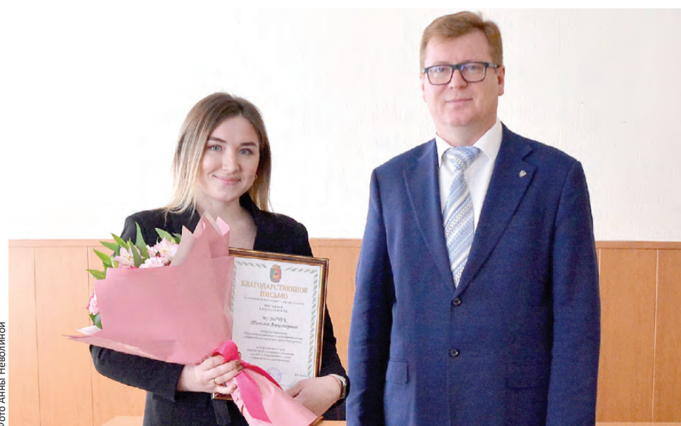
Глава пожелал коллегам успехов и энергии