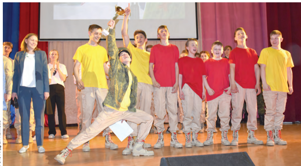
Команда «Кадет-караульный» – первое место!

По итогу всех испытаний, оценивавшихся по пятибалльной шкале, первое место