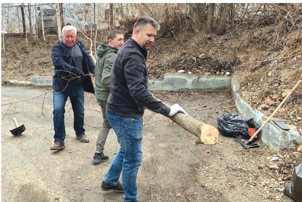
Около приемной «Единой России» не только делали уборку, но и кронировали деревья