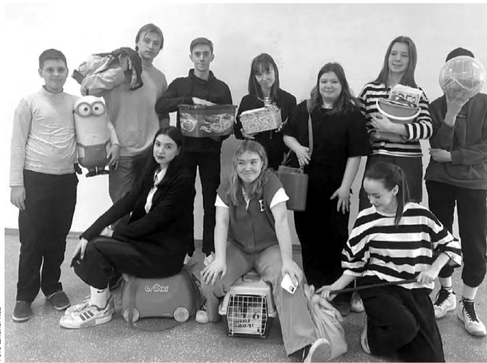
Фото школы №2

В течение недели дети и взрослые развивали навыки жизнестойкости. Каждый класс выпустил постер, сформулировав свои «10 поводов для счастья». Например, будьте благодарны; делайте что любите; верьте в себя... Ученики младшей школы подготовили стенгазеты «Наш дружный класс» и нарисовали рисунки «Как прекрасен этот мир». Младшие школьники поучаствовали в тренингах «Учимся правильно справляться с эмоциями» и «Секреты успешных учеников, или как учиться с радостью». Обучающиеся старшей школы приняли участие в фото-квесте «Что делать без интернета», квест-игре «Золотые правила успешности», игре «Следопыт». Так-