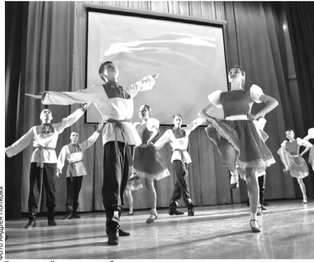
Творческий подарок победителям и призерам муниципального этапа

– Участвуя в проекте «Будь здоров!», ребята учатся рабо-