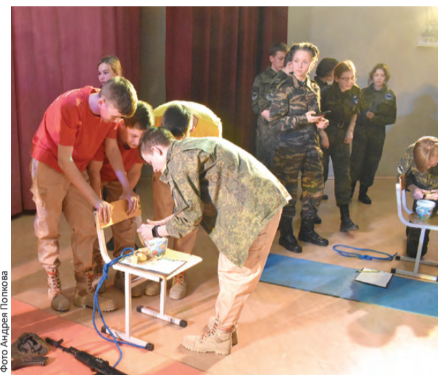
Конкурс капитанов: чистим картошку