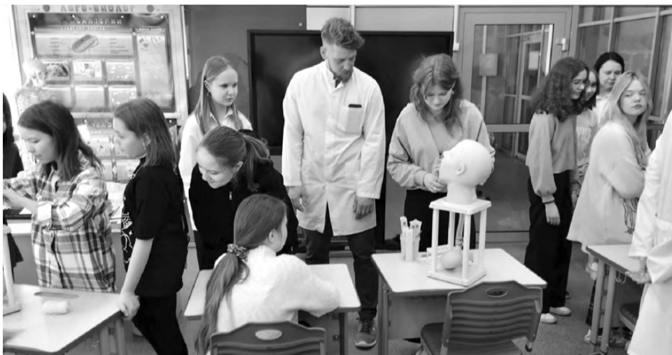
Фото школы №4

По отзывам ребят им запомнился каждый день смены, но наибольший интерес вызвали мероприятия, которые прошли при поддержке социальных партнеров школы. Так, каникулы начались с того, что студенты и преподаватели филиала ГБПОУ «Свердловский областной медицинский колледж» (г.Ревда) провели за-