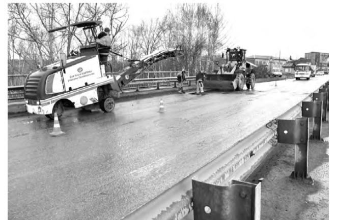
Идет подготовка к ямочному ремонту на Динасовском шоссе

Наряду с ямочным ремонтом в городском округе пройдет и капитальный ремонт дорожного полотна. В последние годы был выполнен серьезный объем работ в городе, поэтому в 2023-м сделают упор на сельской части округа. Так, например, в поселке Доломитовый, на улице Мира, уже начались рабо-