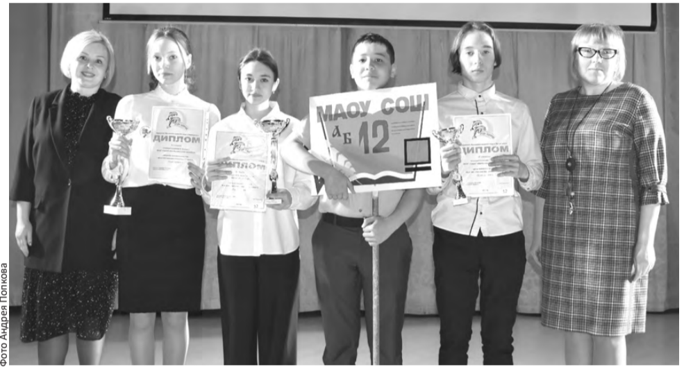
С третьим местом принимает поздравления команда школы №12