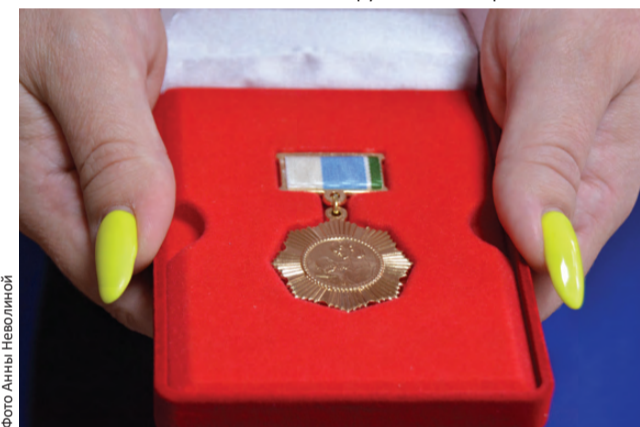
Региональный знак отличия «Материнская доблесть»