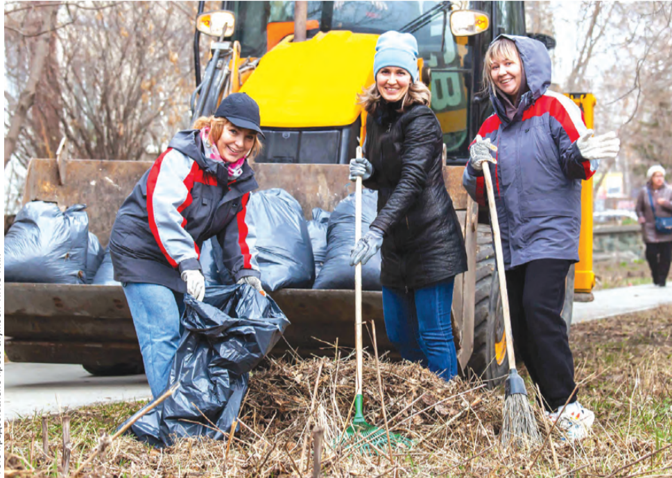
Фронт работ ПНТЗ ТМК – 51 гектар

уборке участвуют все подразделения предприятия, в том числе заводоуправление. Так, во время общегородского субботника более 350 сотрудников ПНТЗ ТМК собрали 11 тонн мусора в районах улиц Комсомольская и Гагарина. Уже субботничали новотрубники и на улицах Папанинцев, Ленина, Ватугина, на проспекте Ильича и набережной. Кроме того, Совет ветеранов и Совет молодежи завода традиционно выйдут в районы сквера Данилова и родника у стелы Европа-Азия. Также к 22-летию ТМК новотрубники высадили 22 дерева в рамках весенних экологических мероприятий.