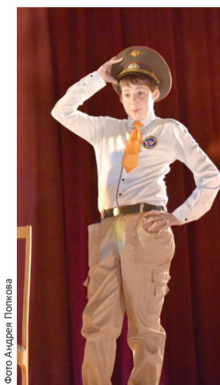
На сцене – «Крылатая гвардия»