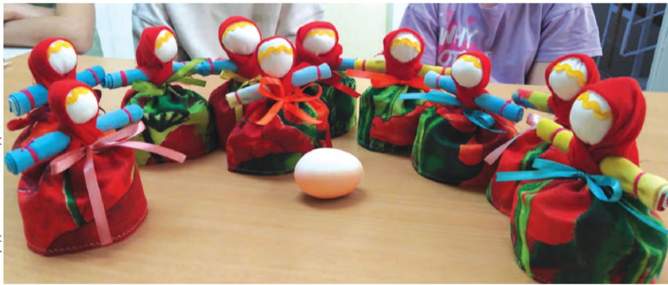
Вот они, красавицы, куколочки на пасхальное яйцо

ройной пасхи здесь приводить не будем. А вот о пасхальных куриных яйцах рассказать, конечно, надо. Их было два вида – крашенки и писанки. Крашенки – это когда яйцо отваривали вкрутую, красили в один цвет. Их ели. А вот писанки делали на подарок. Даря писанку, человек как бы говорил: вот, я желаю тебе счастья и здоровья. Были и мастера росписи по яйцам, назывались они писанкарями, у каждого – свои секреты, которыми они не делились. И никаких тебе красителей, термопленки либо луженой шелухи.