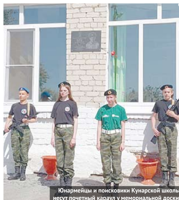
Юнармейцы и поисковики Кунарской школы несут почётный караул у мемориальной доски.

После торжественной части для школьников была организована военизированная эстафета, на территории школы работала полевая кухня.