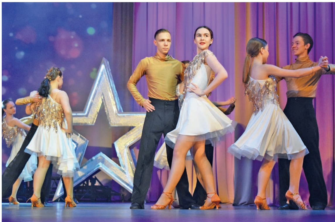
Ансамбль бального танца «Рандеву»

18 мая прошёл отчётный концерт коллективов Дворца культуры. Как всегда это было яркое и трогательное зрелище. В зале не было ни одного свободного места, некоторым зрителям пришлось стоять в проходе.