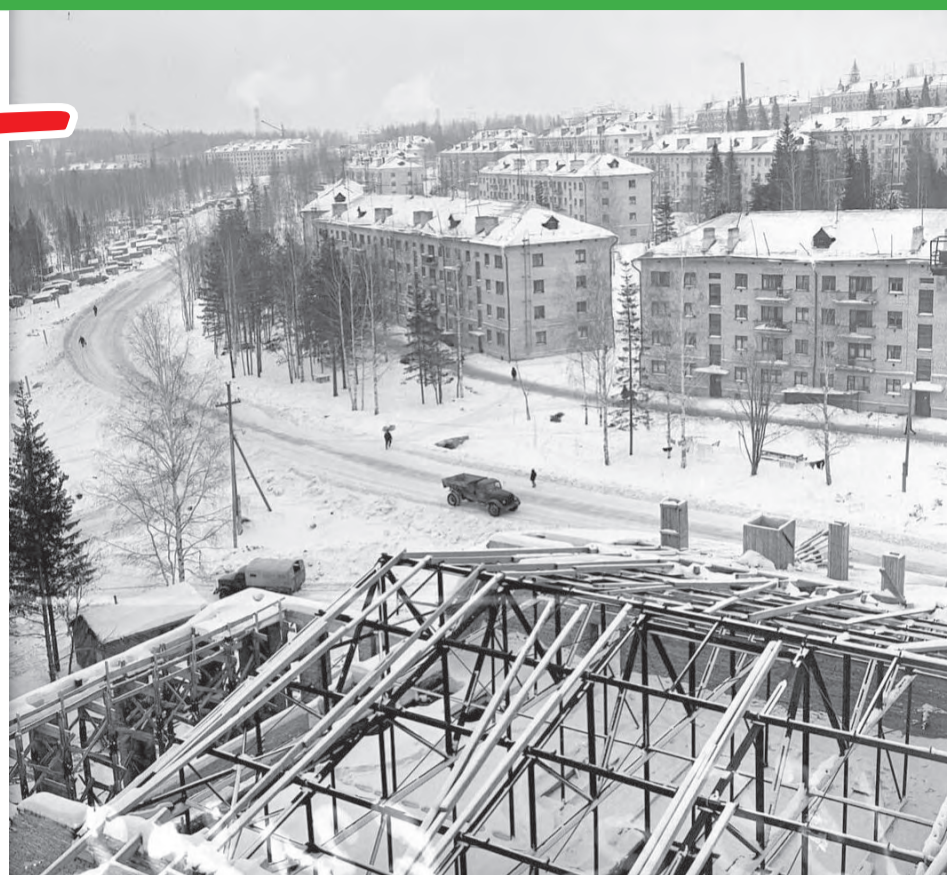
Вид на улицу Свердлова. 1960-е годы. На переднем плане крыша строящегося Дворца культуры

Та первая рабочая весна оставила в сердцах глубокий след. Строители! Высокая цена у ваших скромных будничных побед! 2019 год