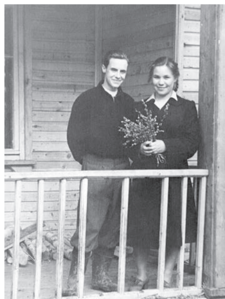
Молодые строители Качканара

Над лесом возвышаются высотки, уютно им в объёмах высоты. Мы с гордостью глядим на эти фотки: наш город — просто кладезь красоты! 2022 год