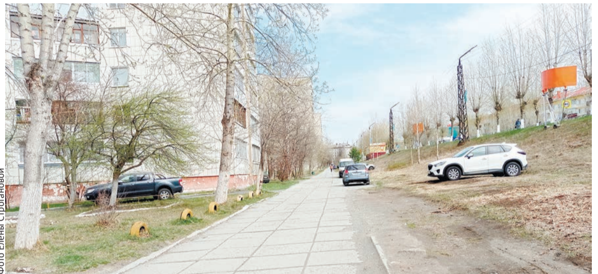
Нередко качканарцы паркуют свои авто прямо на газоне под окнами

В связи с многочисленными обращениями собственников по вопросам организации парковок на придомовой территории, а также в связи с наличием конфликтных ситуаций между собственниками при парковке автомобилей рядом с домами, управляющая компания «Наш дом» разъясняет.