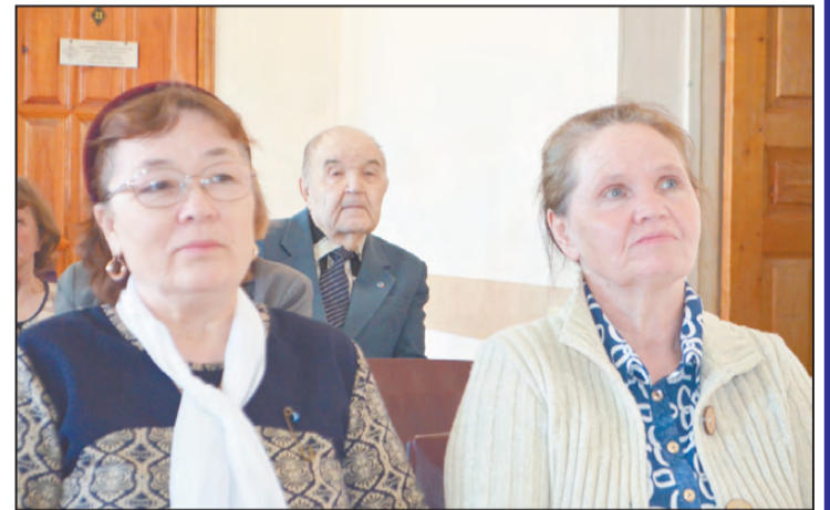
Во время заседания.

- На расчетный счет организации поступило 250,6 т.р. Переходящий остаток на начало года – 67,3 т.р. Источниками поступлений стали пожертвования юрлиц и взносы наших членов. Помощь оказали Артинское райпо (3,0 т.р.), ООО «Аудит-контракт» (6,0 т.р.), ООО «Артидорсервис» (30,0 т.р.), МУП ЦРА №80 (1,0 т.р.), предприниматель С. Цивунин (1,0 т.р.). Всего от юрлиц поступило 50,4 т.р. От членов организации АГО по-