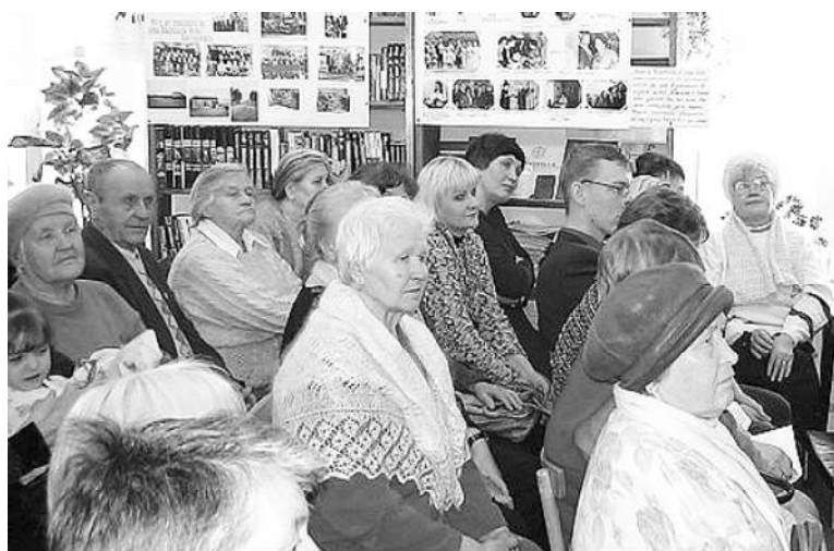
Презентация книги об Юшале.