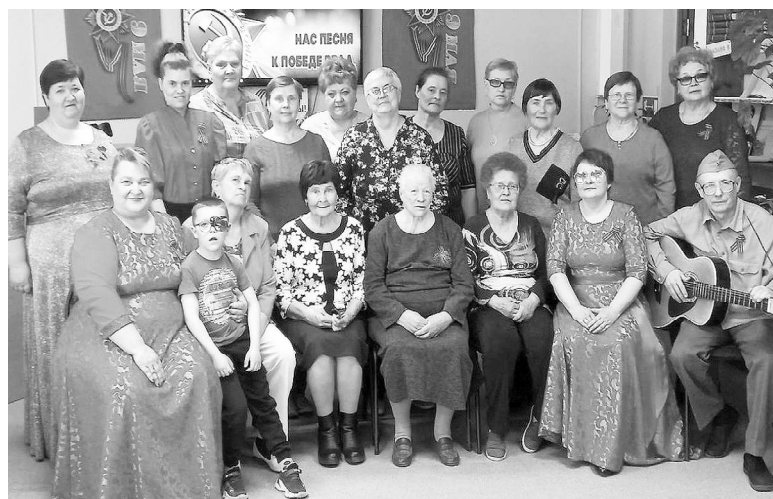
Литературно-музыкальный вечер «Нас песня к Победе вела». 2023 г.