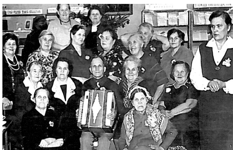
Женсовет Юшала в Тугулыме.