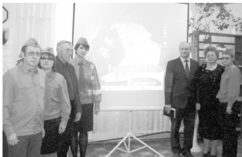
2015 г. Презентация программы «В одном строю Победы».