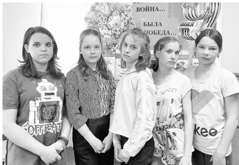
Мероприятие в детской библиотеке.