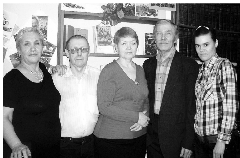
Члены клуба «Родники».