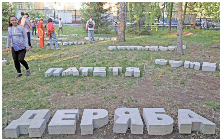
Содержание семитомного словаря превратилось в арт-объекты.

Но наиболее популярным местом оказались Плотинка и старинная водонапорная башня. Посетители толпились у самого маленького выставочного зала площадью менее половины квадратного метра, чтобы увидеть собрание миниатюр — пейзажи, достопримечательности и памятные места, копии картин и экспонатов музеев. А еще писали послания для «капсулы времени», которую заложат в день 300-летия Екатеринбурга, ведь история не только в музеях живет, она делается нами сегодня и сейчас.