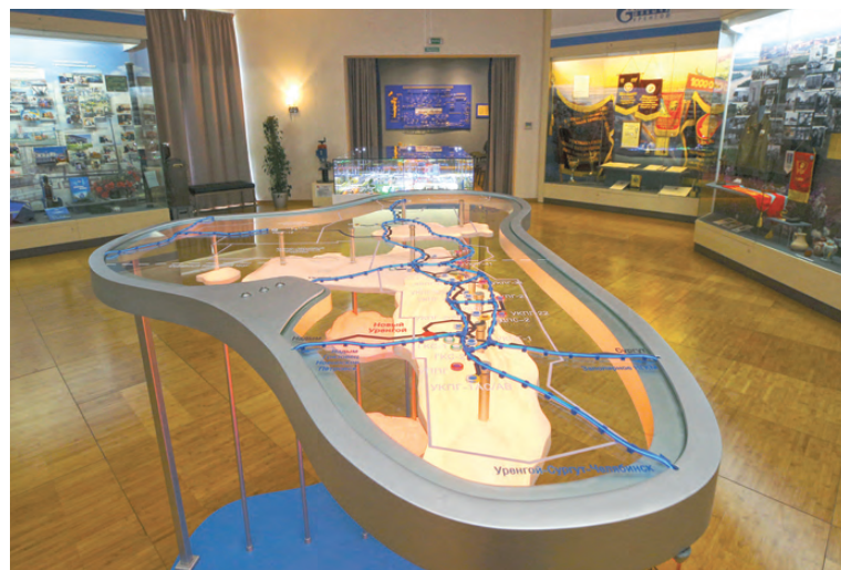
Одно из центральных мест в корпоративном музее занимает трехмерная модель Уренгойского нефтегазоконденсатного месторождения.

менных реалий, уделяя много внимания новым технологиям. Неизменным на протяжении сорока лет остается самое важное — через историю развития Общества, его трудовые и социальные достижения музей рассказывает о становлении нашего города и региона, — отмечает начальник службы по