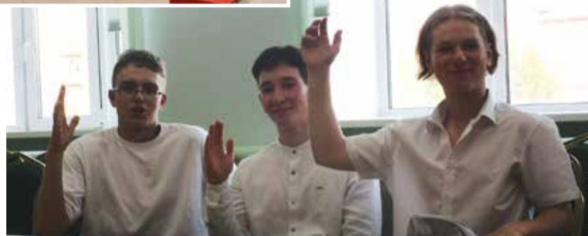
Молодёжь голосует за перемены

В завершении презентации собравшиеся задавали вопросы к представителям архитектурной студии, в частности о парковке на площади, о