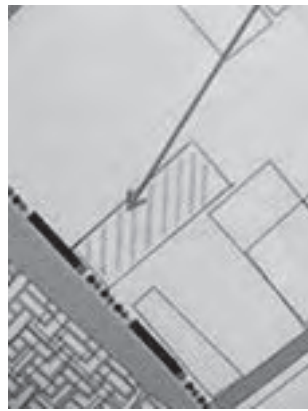
зайства в аренду:

ТОЛЬКО КАЧЕСТВЕННЫЕ ОКНА БАЛКОНЫ УДОБНЫЙ КРЕДИТ БЕСПРОЦЕНТНАЯ РАССРОЧКА СКИДКИ ПЕНСИОНЕРАМ скидки до 50% магазин "ОКНА&ДВЕРИ" ТЦ Шоколад, ул. Советская 94 Тел: 89021569210 (34355)69-210