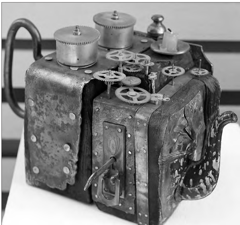
Объект 1 из триптиха «Коммуналка», автор Максим Нуштаев.