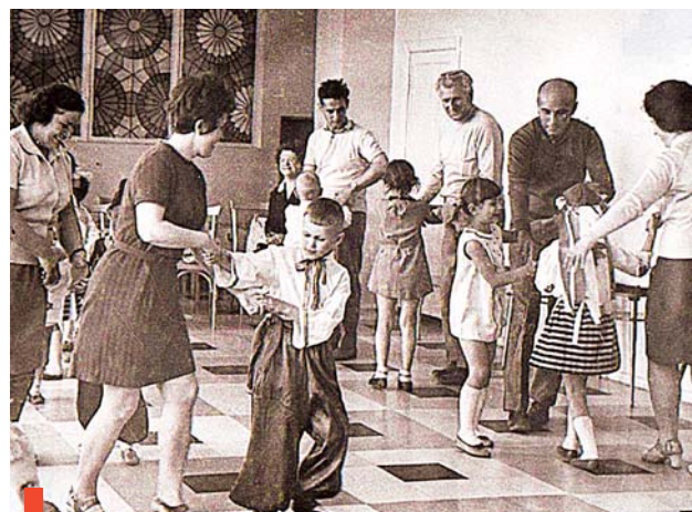
Танец дружбы в детском саду №2

Прибыв на сухоложскую землю 16 мая, три десятка работников народного образования и сельского хозяйства ЧССР в первую очередь посетили школы №1, 2,