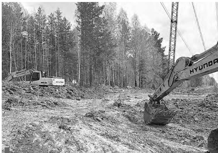
Противопожарная расчистка линии электропередачи