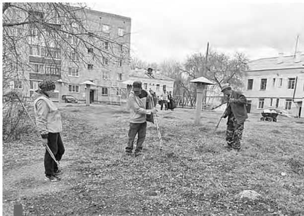
Ул. Победы, 15А

В преддверии майских праздников работники УК «Сухоложская», сотрудники предприятий и организаций и жители городского округа вышли на субботники.