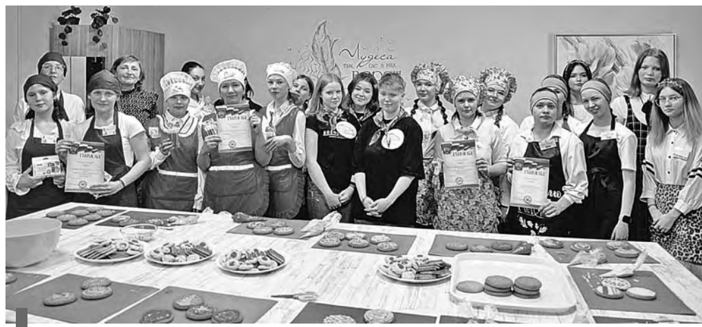
Участники муниципального конкурса «Первые шаги в профессии»