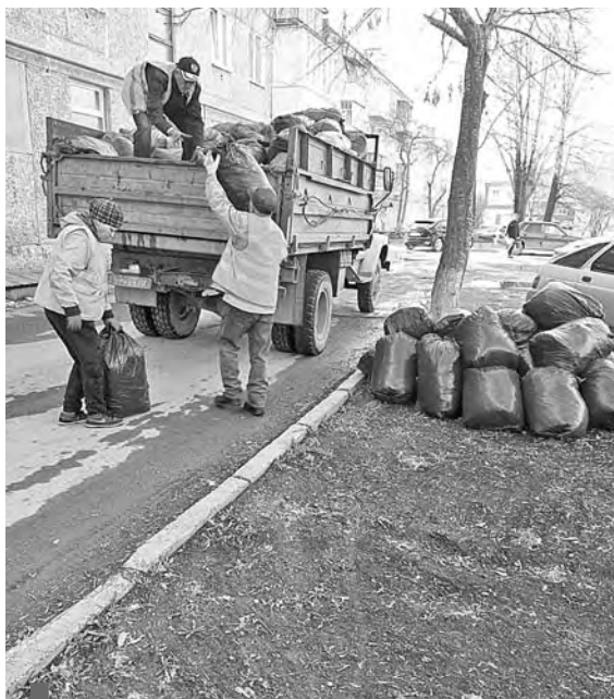
Ул. Октябрьская, 6

С удовольствием хочу поблагодарить тех, кто не остался равнодушным к призыву убрать с придомовых территорий накопившийся за зиму мусор, чтобы майские праздники любимой городской округ Сухой Лог встретил в чистоте и уюте. Горожан, проживающих на ул. Строителей, 5, ст. Кунара, 7, 8, 9, ул. Полевой, 2, в пер. Буденного 3, 3А, 5, 5А. Жителей домов №2 на ул. Фучика и №16 на ул. Победы, дома №9 на ул. Вокзальной и №3А на ул. Милицейской, а также жителей многоквартирных домов №5 на ул. Кирова, №13 на ул. Октябрьской и №4 на ул. Дружбы. В селе Курьи – жителей ул. Свердлова, 26, 28, 39, ул. Кооперативная, 5. В селе Филатовском – жителей ул. Ленина, 80 и 82. В селе Новопышминском – жителей ул. Ильича, 1, 2, 16.