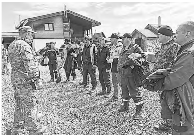
Инструктаж добровольцев перед отправкой в лес