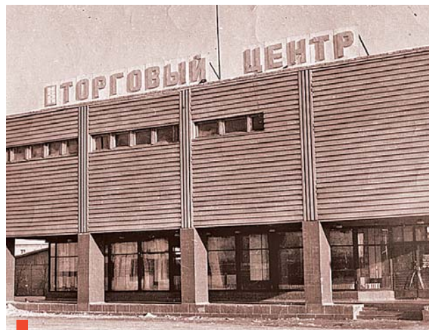
Торговый центр занял место на главной площади села

Отмечала газета «Знамя Победы» и проблемы. Например, неработающие вентиляцию (отчего в торговых залах было душно) и лифт-подъемник – продавцам приходилось вручную поднимать то-