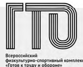
Всероссийский физкультурно-спортивный комплекс «Готов к труду и обороне»

Обращаться в спорткомплекс «Здоровье» (ул. Октябрьская, 14А, тел. 4-48-81).