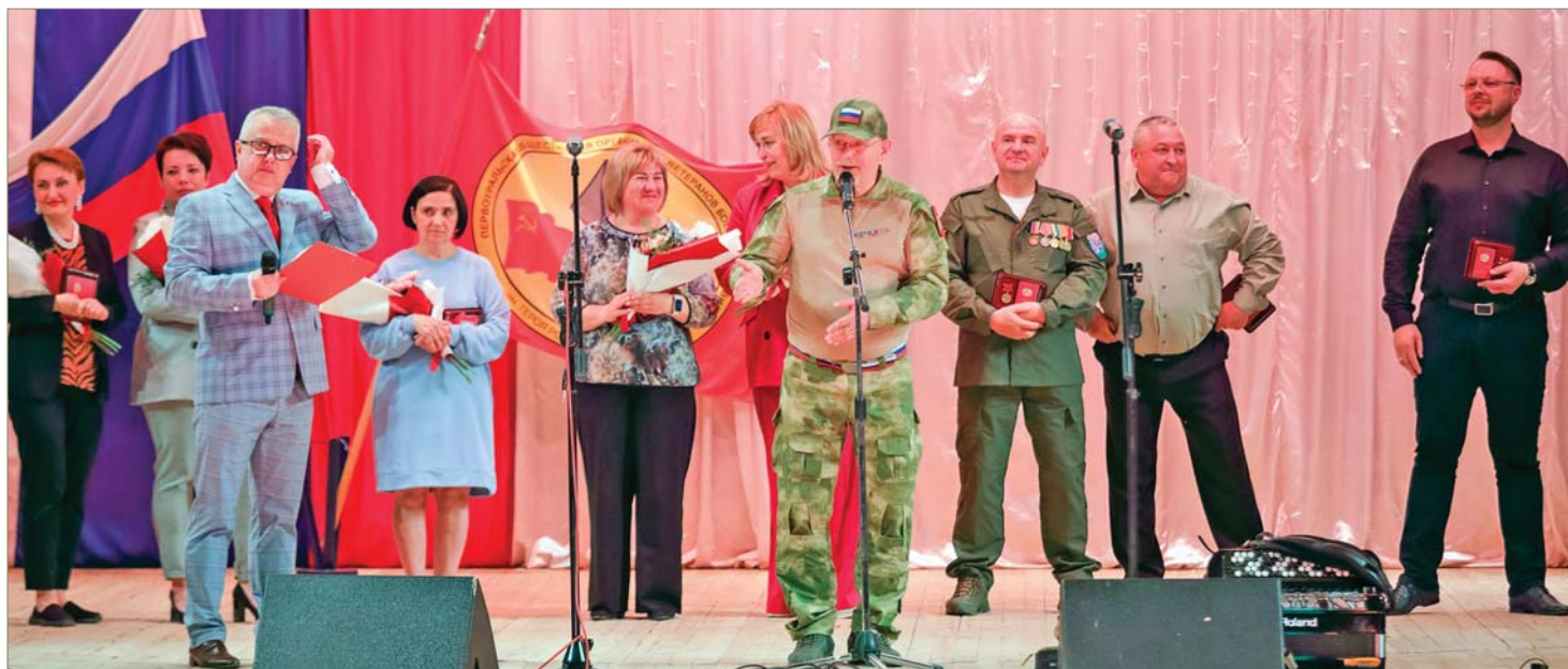
Помогают по зову сердца.

Под аплодисменты зала на сцену один за другим поднимались герои «невидимого фронта». Те, кто творит добро, обычно предпочитают оставаться в тени, в этот вечер они услышали много слов благодарности, смогли разделить радость от признания с единомышленниками.