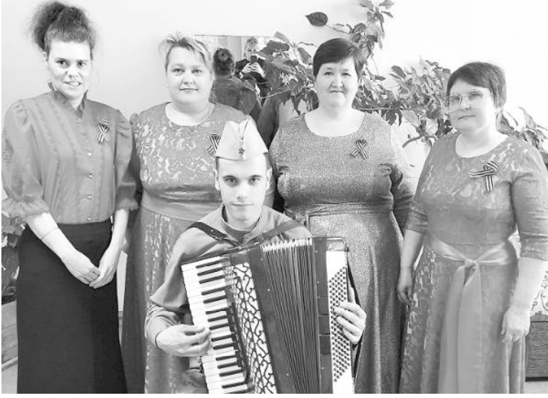
78 лет отделяют нас от ликующей весны сорок пятого. Но время никогда не сотрёт из памяти народа Великую Отечественную войну, самую тяжёлую и жестокую из всех войн в истории нашей Родины.