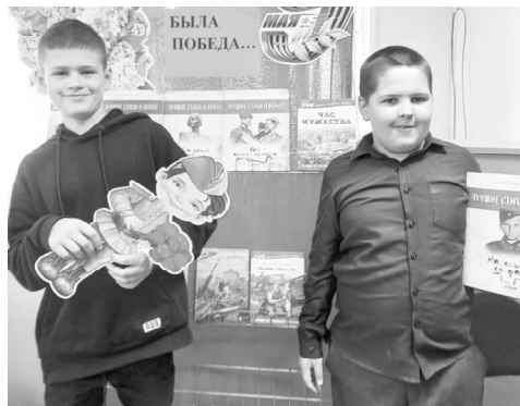
Есть события, над которыми время не властно, и, чем дальше в прошлое уходят годы, тем яснее становится их величие. К