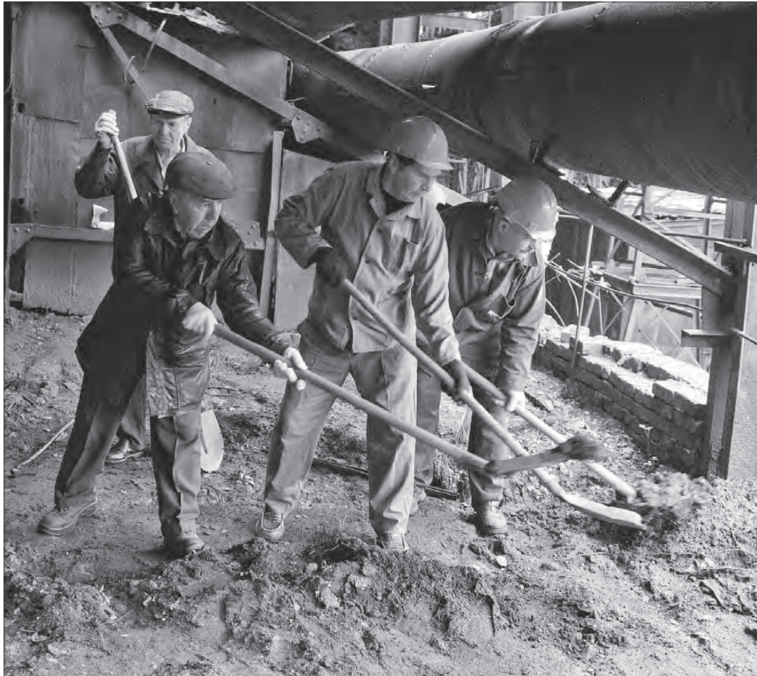
Участники Волонтерского Движения Ветеранов пришли сюда работать, а не ради пиара.

Так что, если у вас есть возможность и желание, можете вливаться в ряды ВДВ – Волонтерского Движения Ветеранов или создавать свои волонтерские бригады.