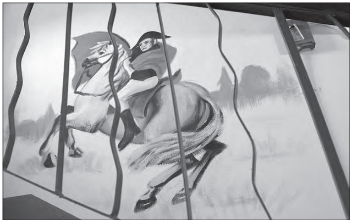
Все подъезды дома 21а по улице В. Черепанова расписаны на славу, но в призеры вышел первый, посвященный России.