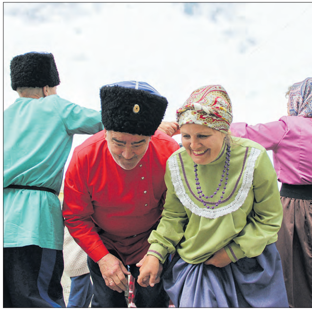
Фото: Мариинские избы

А еще в этот день в ДК села Мариинск (ул. Мичурина, 3) пройдет концерт-избушка казачьего ансамбля «Вечоры». Артисты исполняют для зрите-