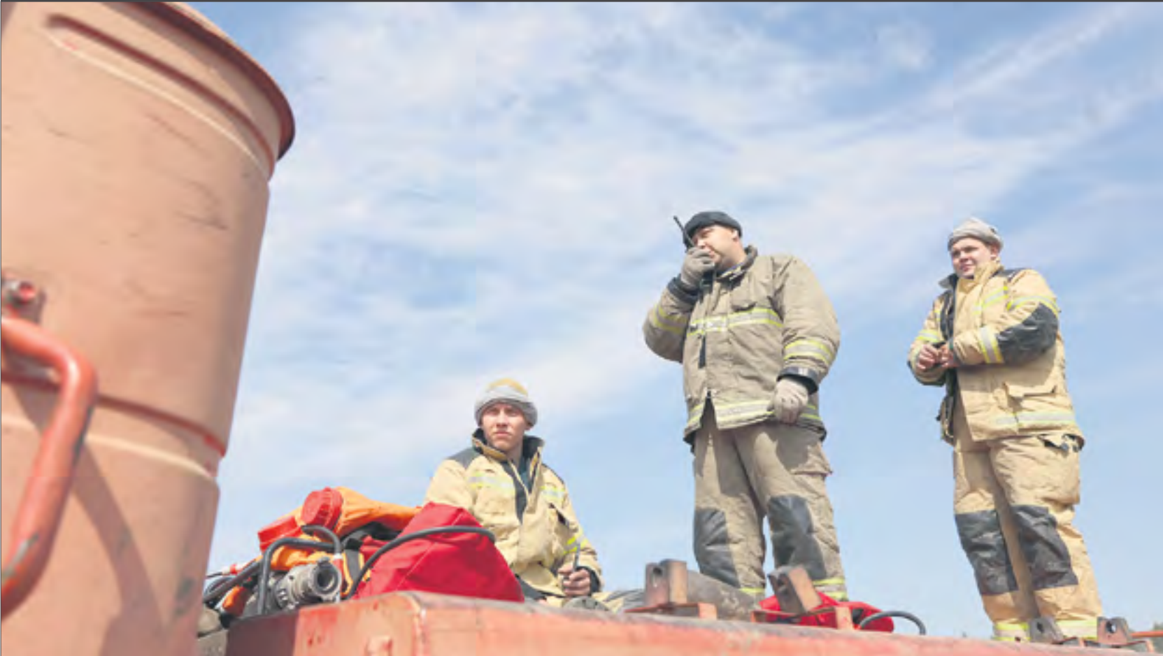
Лесной пожар в Ревде продолжался почти неделю. Только в пятницу пожарные, лесники и волонтеры смогли выдохнуть, когда выяснилось, что все крупные очаги ликвидированы.