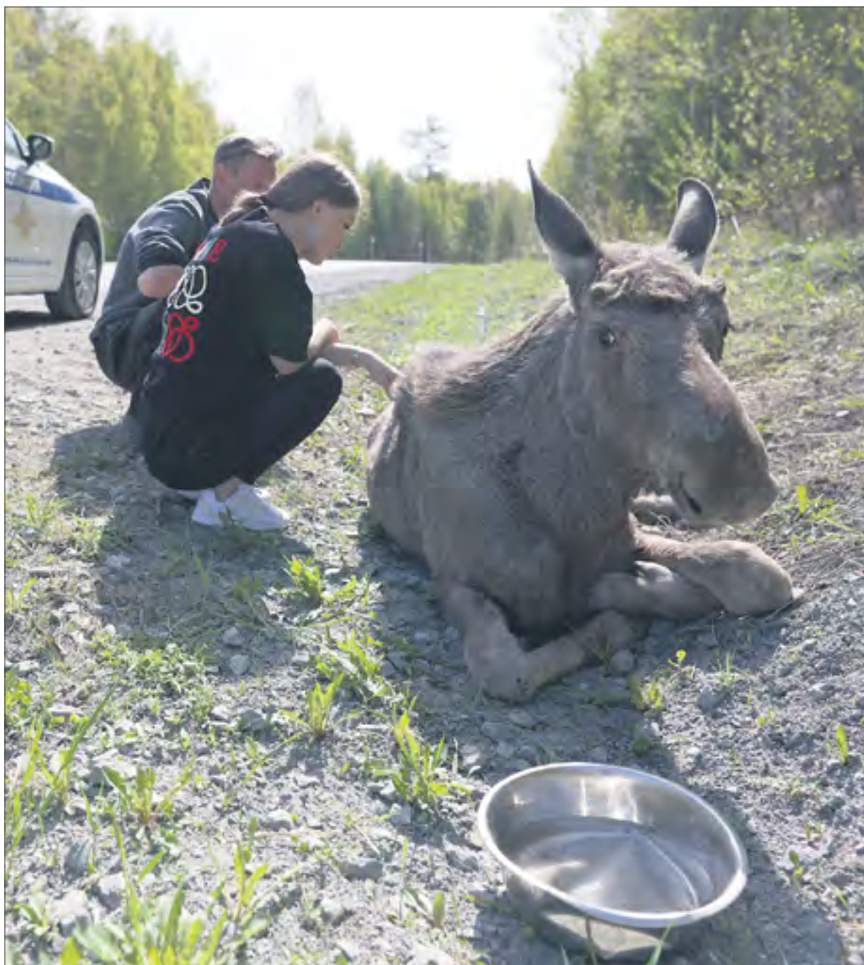
Общественники до последнего верили, что лосёнок получится спасти и помогли раненому животному как могли.

Почему погиб лосёнок, которого пытались спасти общественники