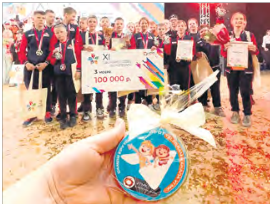
За третье место ревдинская команда получила сертификат на 100 тысяч рублей.

Призовой фонд спартакиады составил около 1,5 млн рублей — все команды-участники получили сертификаты на приобретение спортивного инвентаря.