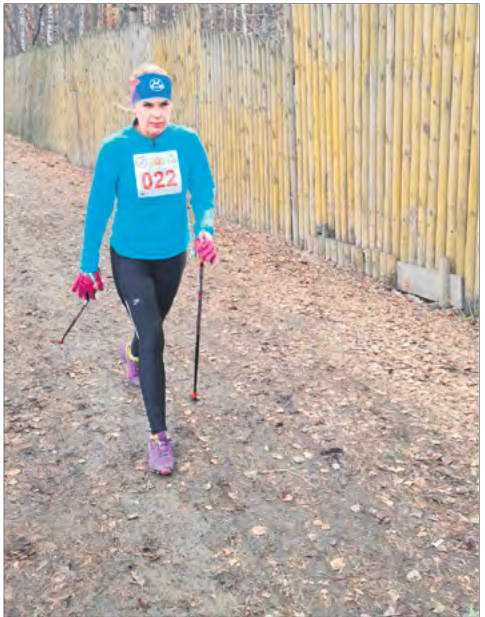
Соревнования по спортивной ходьбе — это совсем не просто. Важно соблюдать технику, иначе можно нахватать много штрафов.

— Я сначала думала: «Что за ерунда? Взял палки и пошел куда-то». А потом он начал меня привлекать, мол, пойдём, прогуляемся, я с палочками, а ты просто попробуешь. Так и начала заниматься. И чем дальше, тем больше. В ко-