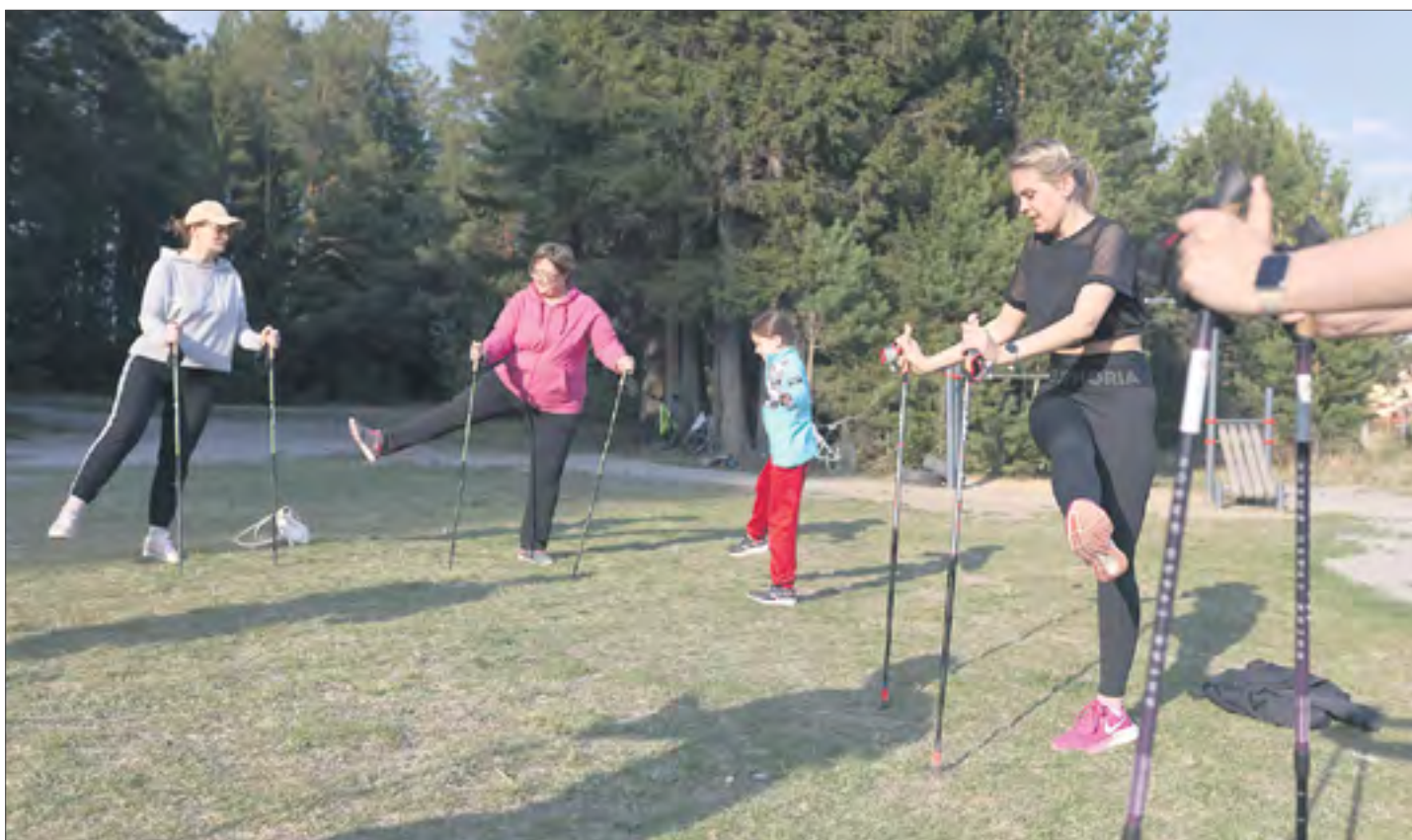
Тренировки проходят три раза в неделю: во вторник, четверг и воскресенье.