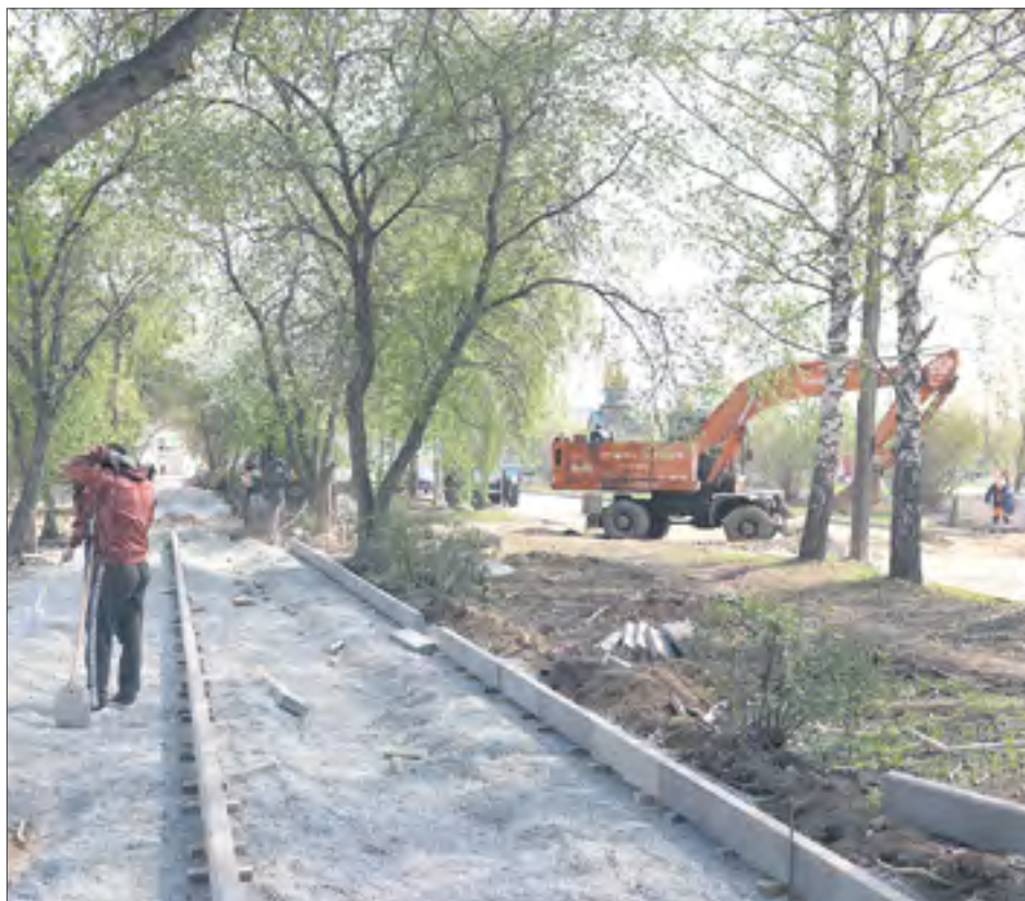
Скоро на будущих тротуарах появится красивая плитка.

— Сейчас подрядчик, судя по графике, должен проводить электромонтажные работы и заливать фундаменты под МАФы, — комментирует увиденное Сергей Филиппов. — Если с наружным освещением всё более-менее понятно, то с последним пока задержка, так как все параметры прописаны в паспортах изделий, то есть мы получим их вместе с оборудованием. Поэтому сейчас ждем поставку, чтобы понимать реальные размеры конструкций. Сейчас нужно будет закончить земляные работы в сквере у «Калейдоскопа». Чтобы уйти от дождя, нужно вылезти из земли. Поэтому ускоряйтесь. Тут всё уже подготовлено к плитке, сейчас сухо, поэтому не нужно ждать, когда погода испортится.