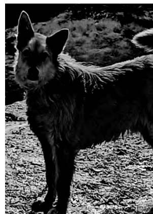
МАЛЫШ. Крупный, послушный, подойдет для охраны