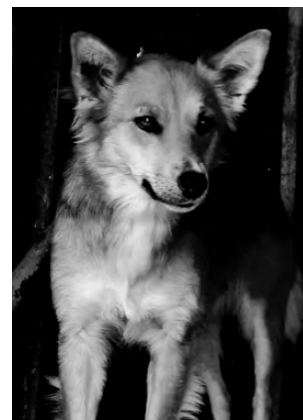
ЛИСИК. Маленький пёсик, спокойный, послушный, подойдет для двора