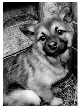
ЩЕНКИ. Возраст 3 месяца, стерилизуем по достижению возраста