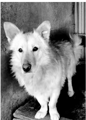
КОРГИ. Небольшого роста, спокойный, послушный, подойдет для дома

В городе Реж в пункте кратковременного содержания безнадзорных животных находятся собаки и кошки, готовые обрести дом и любящих хозяев. Животные прошли ветеринарный карантин, поставлены необходимые прививки. Есть щенки и котята, возраст от 1 месяца до года. Если Вы хотите обрести друга и надёжного охранника, звоните по телефону 8-912-674-23-28 . Мы можем доставить вам поправившееся животное. Уважаемые режевляне, если у вас есть возможность помочь кормом для животных, то мы с радостью примем крупы (кроме перловой - ее собакам нельзя), макаронные изделия, кости, лапки кур, хлеб, сухари, сухой корм. Заранее огромное всем спасибо.