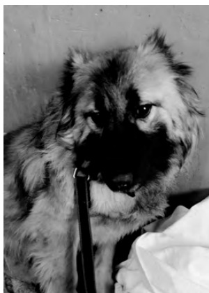
АСТРА. Молодая, спокойная, подойдет для охраны двора