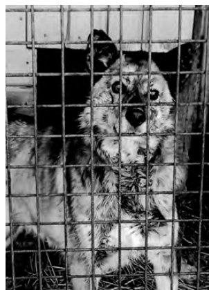
ЛАЙМА. Умная, контактная, хорошая охранница