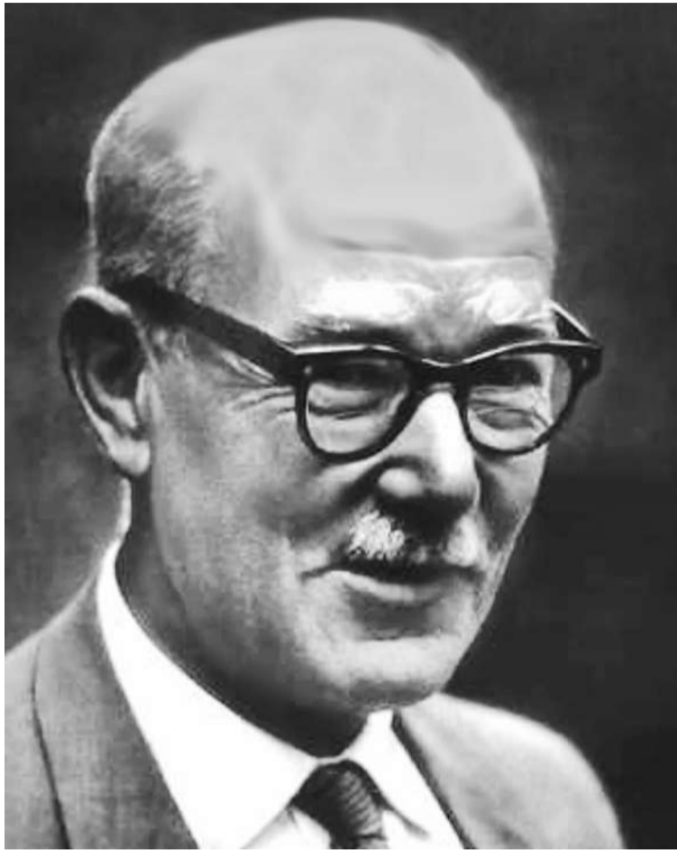
Академик В.В. Парин