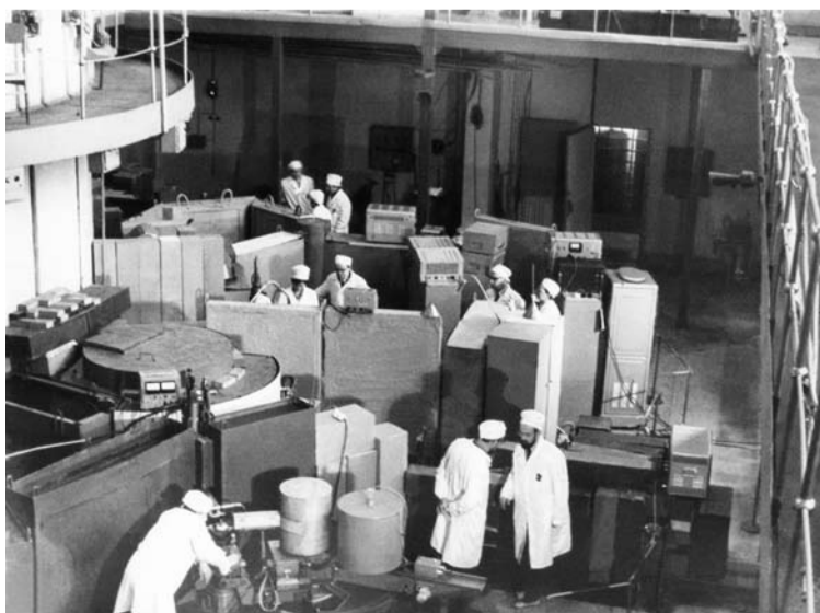
Экспериментальный зал атомного реактора ИФМ