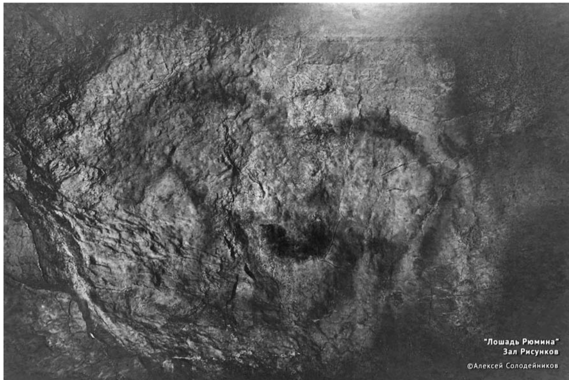
«Лошадь Рюмина» Зал Рисунков ©Алексей Солодейников

пещер, история обнаружения и изучения рисунков, данные химического анализа «живописного слоя», репортаж об очистке залов пещеры от загрязнений и