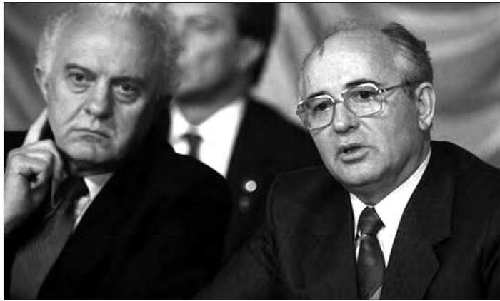
Эдуард Шеварднадзе и Михаил Горбачев.

Как сообщает РБК, в Тбилиси на 87-м году жизни скончался один из архитекторов перестройки, последний министр иностранных дел Советского Союза и бывший президент Грузии Эдуард Шеварднадзе.