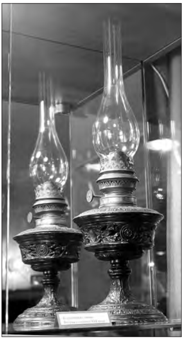
Керосиновые железнодорожные фонари и керосиновые лампы.

Любопытная деталь: изобретение имело огромный успех, но только не в России. В Париже «свечами Яблочкова» были освещены театры, улицы, магазины. В Лондоне «русский свет», как окрестили изобретение газеты, проливался на набережную Темзы и корабельные доки. Сам Яблочков стал одним из самых известных людей в Европе. И только в 1848 году, после Парижской выставки,