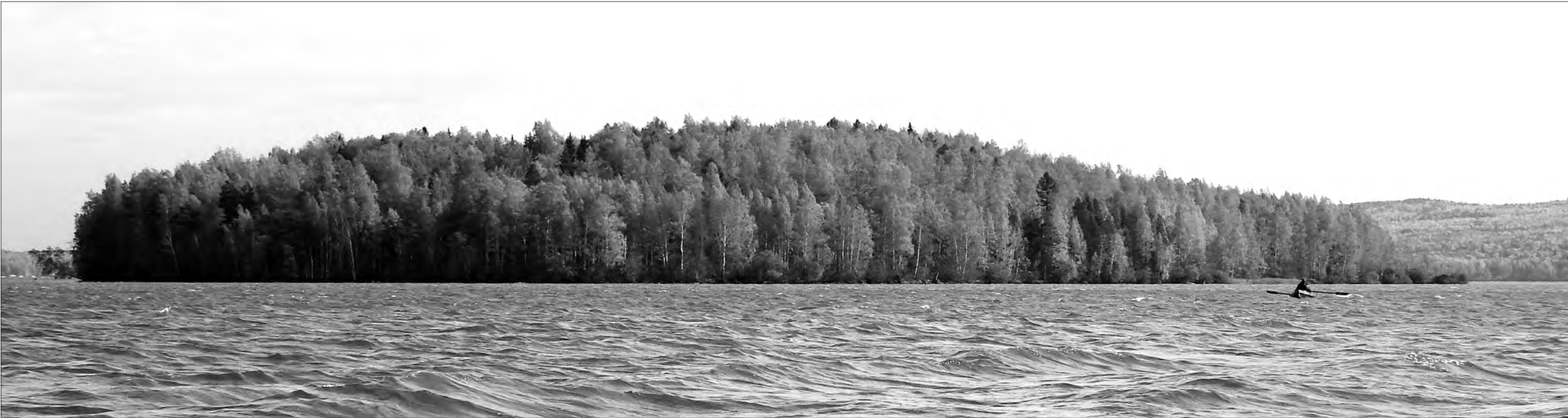
Остров Сосновый.