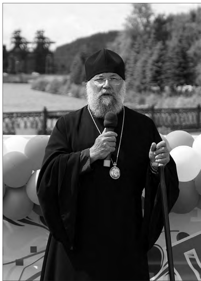
Епископ Иннокентий поздравляет тагильчан с Днем семьи, любви и верности.

Епископ Нижнетагильский и Серовский Иннокентий пригласил всех тагильчан 8 июля в Скорбященский женский монастырь на