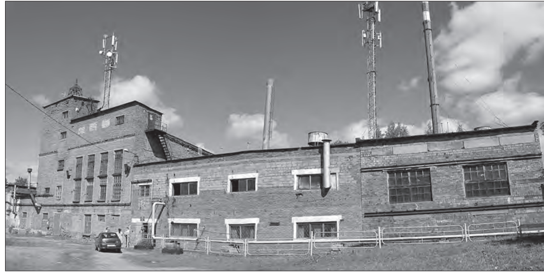
Здание теплоцентрали было построено еще в 1957 году.

ших усилий стоил предприятию полный переход на газовое топливо - это совсем иная экология производства (и действительно, дыма из трубы видно не было - водяной пар с примесью углекислого газа замечен только в холод-