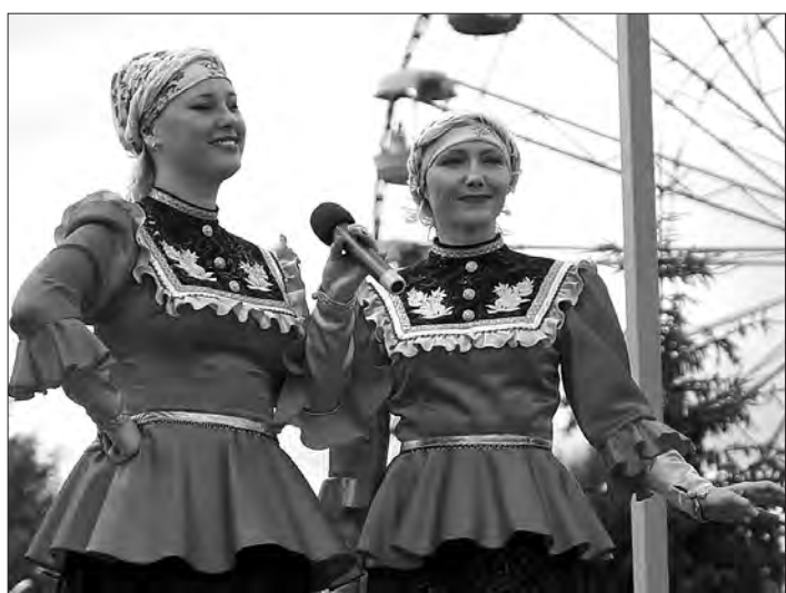
Поют солистки ансамбля «Гуляй-поле».