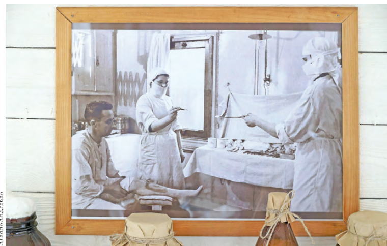
Репродукции архивных снимков демонстрируют будни санитарного поезда.