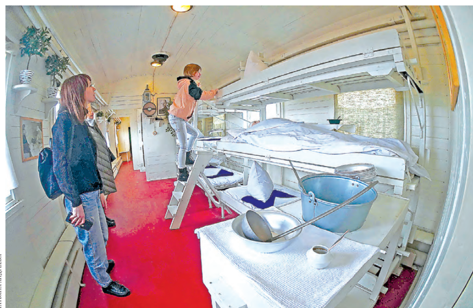
В вагоне вместо полок закрепляли носилки, чтобы не перекладывать лишний раз раненых бойцов.