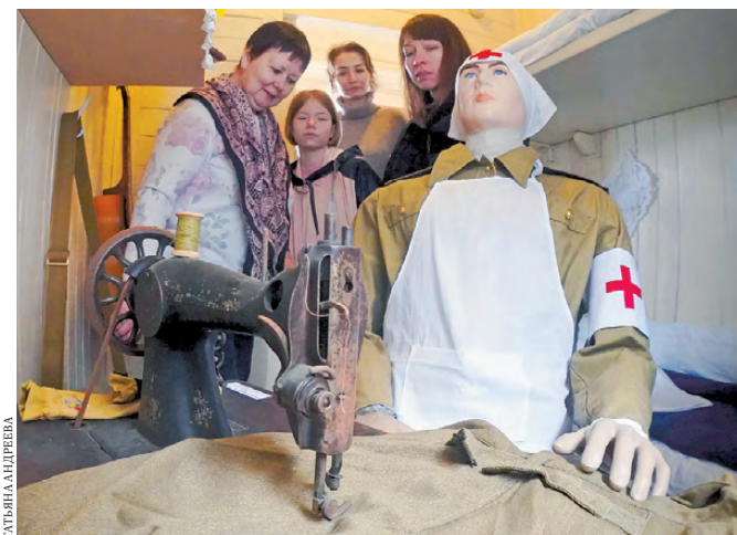
На небольшой площади нашлось место и отсеку для рукоделия.