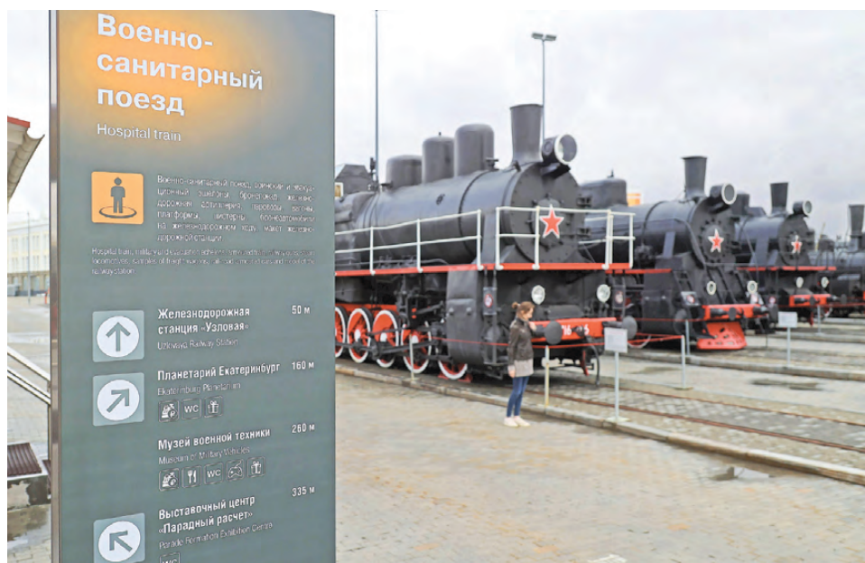
В музейном комплексе воссоздали паровозы 40-х годов прошлого века.

На Урале воссоздали обстановку военно-санитарного поезда