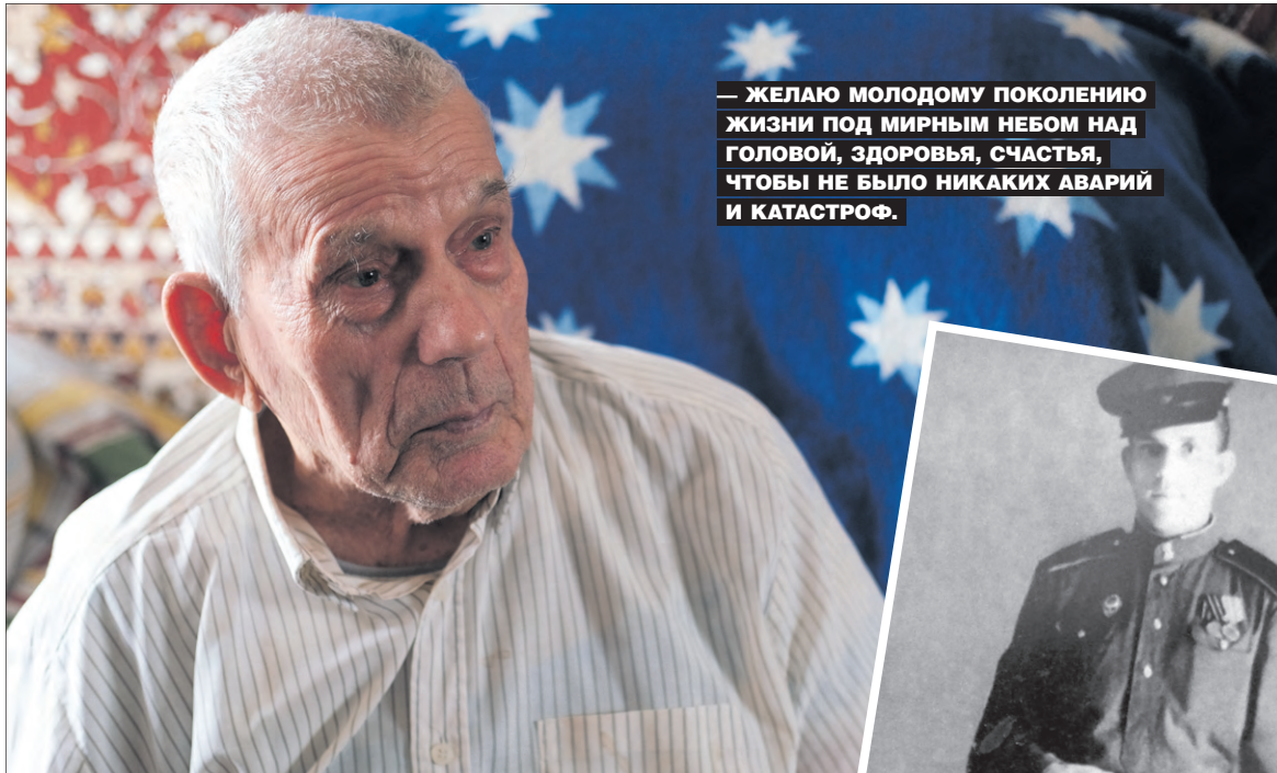
— ЖЕЛАЮ МОЛОДОМУ ПОКОЛЕНИЮ ЖИЗНИ ПОД МИРНЫМ НЕБОМ НАД ГОЛОВОЙ, ЗДОРОВЬЯ, СЧАСТЬЯ, ЧТОБЫ НЕ БЫЛО НИКАКИХ АВАРИЙ И КАТАСТРОФ.

— Жили в бараках, было холодно, одежды никакой не было, грызли мерзлые овощи, — вспоминает ветеран. — Нас готовили на пулеметчиков, ждали отправки на Запад. Но война шла