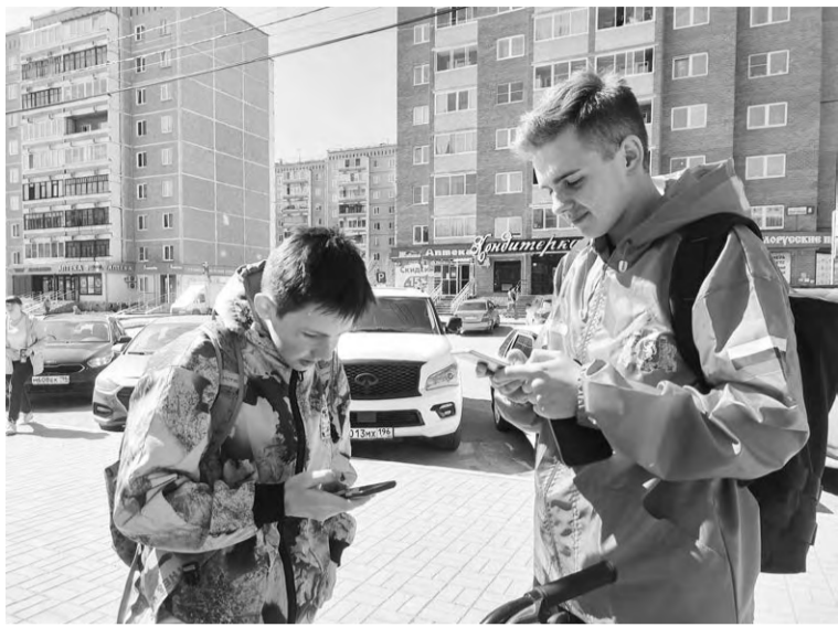
В выходные в городе работают волонтеры

Продолжается Всероссийское онлайн-голосование за объекты благоустройства 2024 года. Голосование, организованное в рамках инициированного