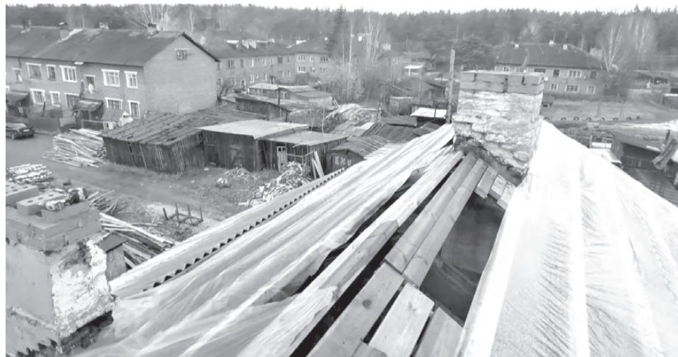
Ремонт домов после пожара в Сосьве

В Сосьве продолжают ликвидировать последствия крупного пожара. Специалисты различных служб и добровольцы, участвующие в аварийно-восстановительных работах, при помощи спецтехники уже полностью расчистили 91 участок.