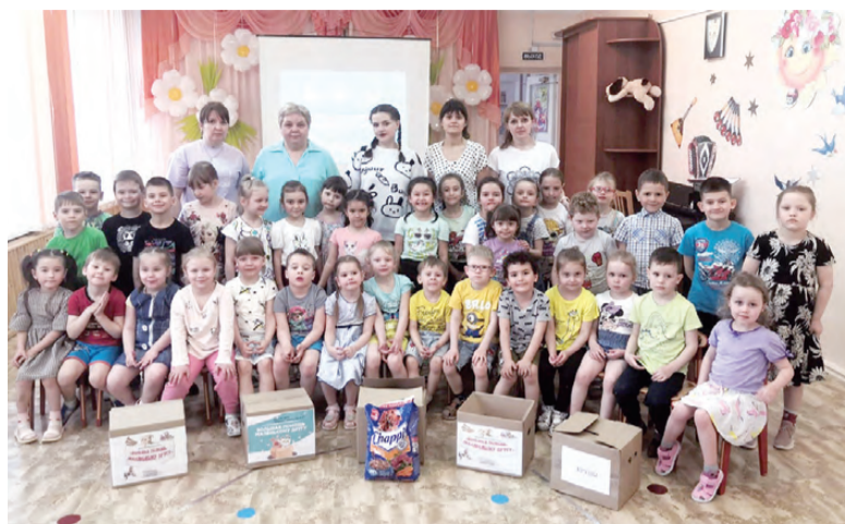
Воспитанники детского сада и педагоги – участники акции

Под таким названием в рамках ежегодной добровольческой акции «Весенняя Неделя Добра» в детском саду №30 прошла благотворительная акция по сбору кормов для бездомных животных.