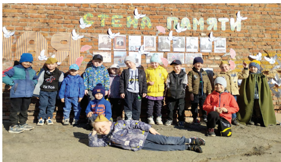
Воспитанники детского сада – создатели Стены памяти

вал в создании экспозиции, с гордостью показывают фотографии своих родственников: прадедушек, прабабушек, тех, кто воевал на линии фронта, и тех, кто в тяжелых условиях работал в тылу, – и рассказывают о своих героических предках.