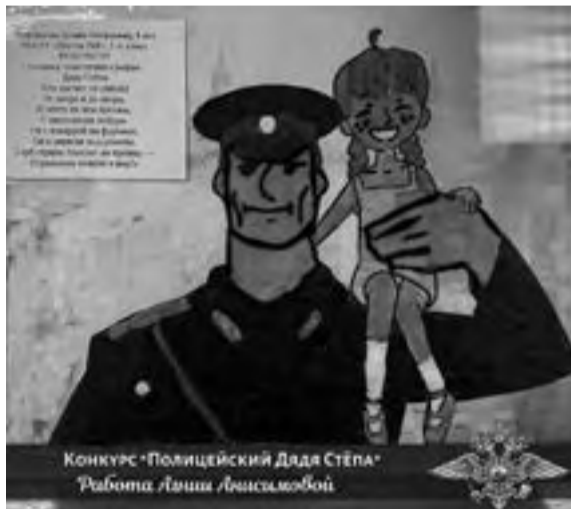
МО МВД России «Ирбитский»

Сотрудники полиции благодарят всех участников конкурса за интересные творческие работы и поздравляют победителей! Лучшие работы из каждой возрастной категории направлены на региональный этап конкурса. Наш город там представ-