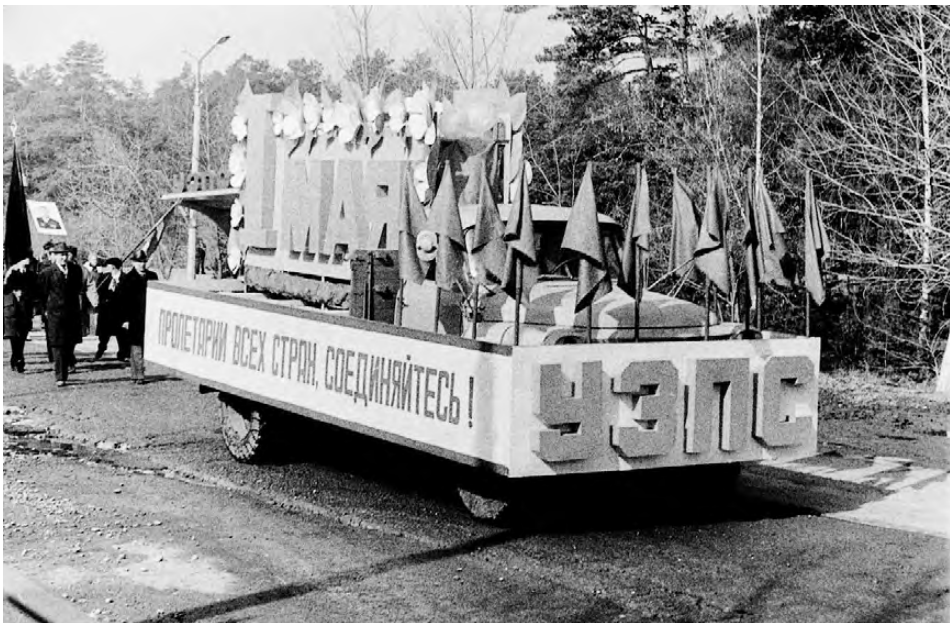
1 мая колонна УЗПС