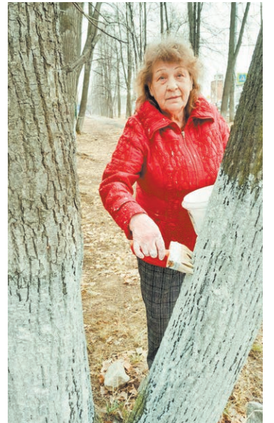
Монетный. Активисты почистили пустырь возле музыкальной школы, прибрали в парке МТРЗ, побелили деревья в Центральном парке.

Огромное спасибо всем участникам субботников: жителям многоквартирных домов и коллективу управляющей организации, которая в полном составе приняла участие в данном