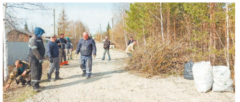
Кедровка. Мужчины из 6 отделения коллективного сада №23 «Юбилейный» вышли на уборку прилегающей территории