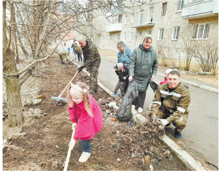
Управляющая компания "ЖКХ-Холдинг" провела массовые уборки во дворах многоквартирных домов

– Хотим выразить благодарность нашему депутату Пермя-