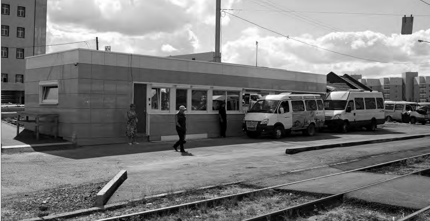
Павильон на трамвайной остановке еще не сдан.