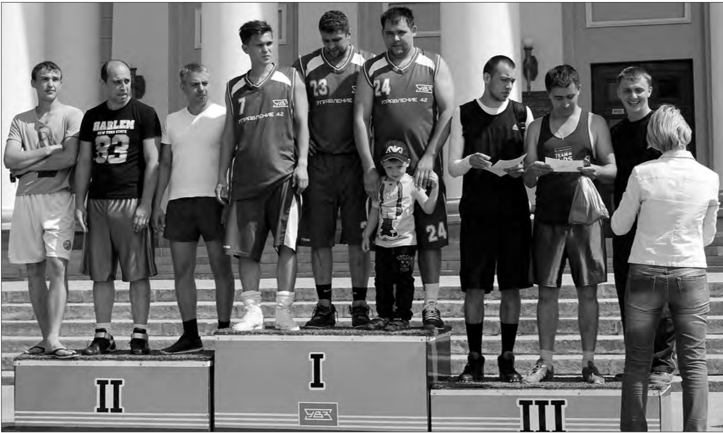
Лучшие команды Уралвагонзавода: первое место – 42-е управление, второе место – цех 160, третье – 99-е управление.