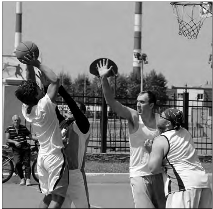
Команда БК «Старатель» прошла через натиск баскетболистов Верхней Салды (они атакуют).