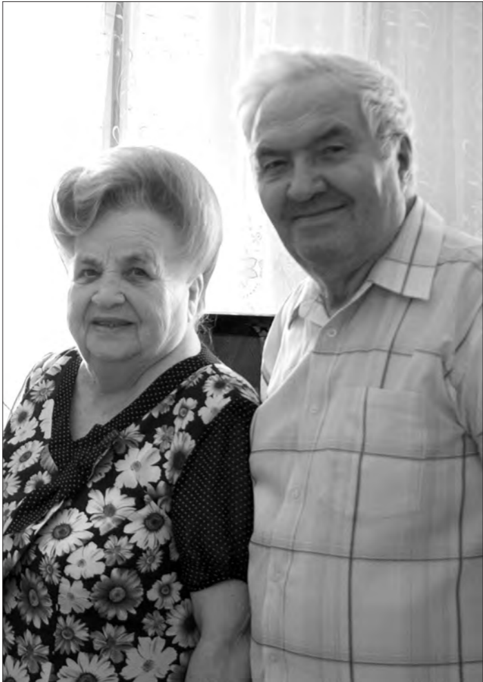
Супруги Глуховы – бриллиантовые юбиляры.

Анастасия ВАСИЛЬЕВА.