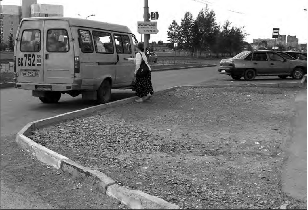
Впереди - автопарковка, позади - выезд из квартала.

Кое-кто из заинтересовавшихся разговором про-