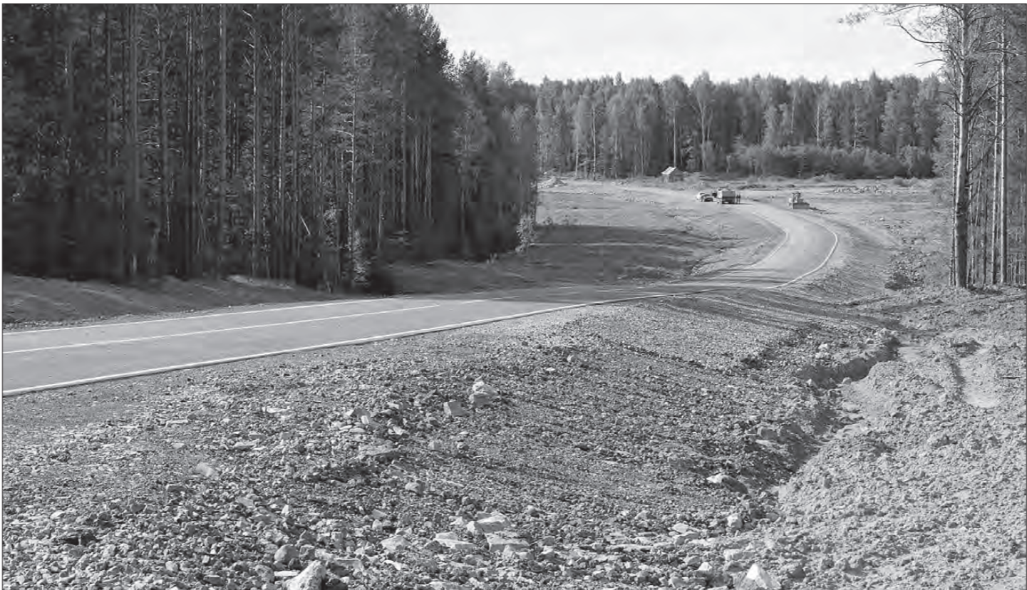
Трасса выглядит почти готовой.

В середине июня бригады ООО «УралДорТехнологии» возобновили работы на так называемом восточном объезде Нижнего Тагила. Напомним, дорога напрямую соединит автостраду Екатеринбург – Серов с салдинской трассой в районе села Покровского. Прямой путь (без заезда в Нижний Тагил) значительно сократит время поездки. Общая стоимость проекта, рассчитанного на три года, два миллиарда рублей.