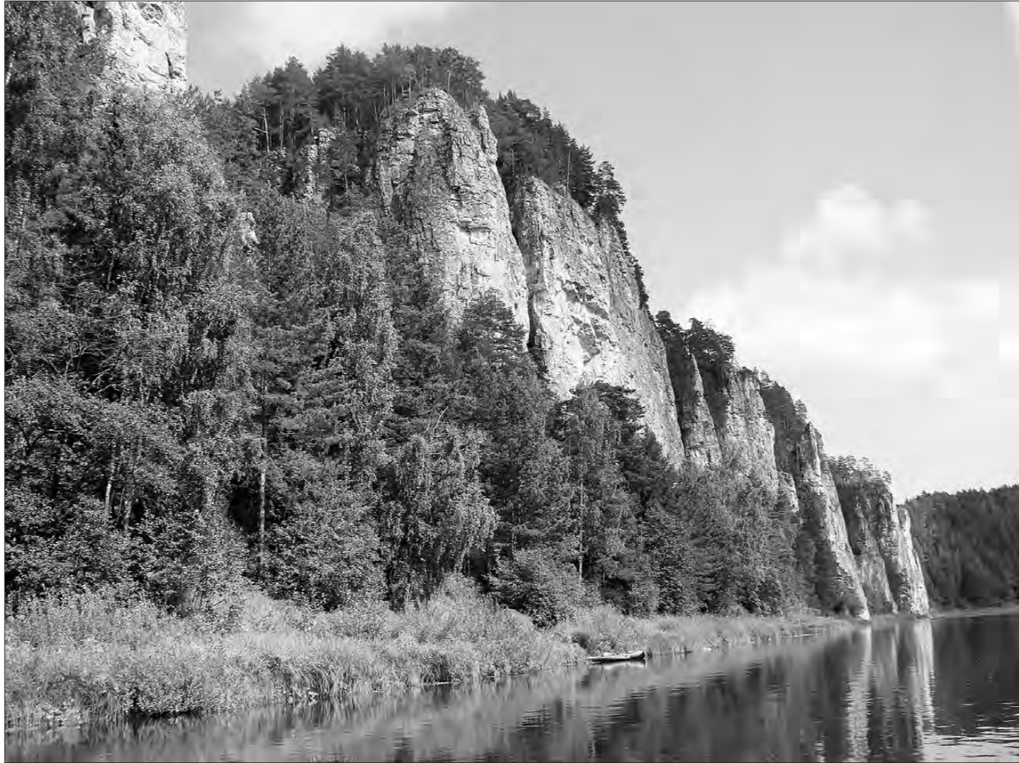
На реке Чусовой - Камень Олений.

В 1865 году были выработаны рекомендации об