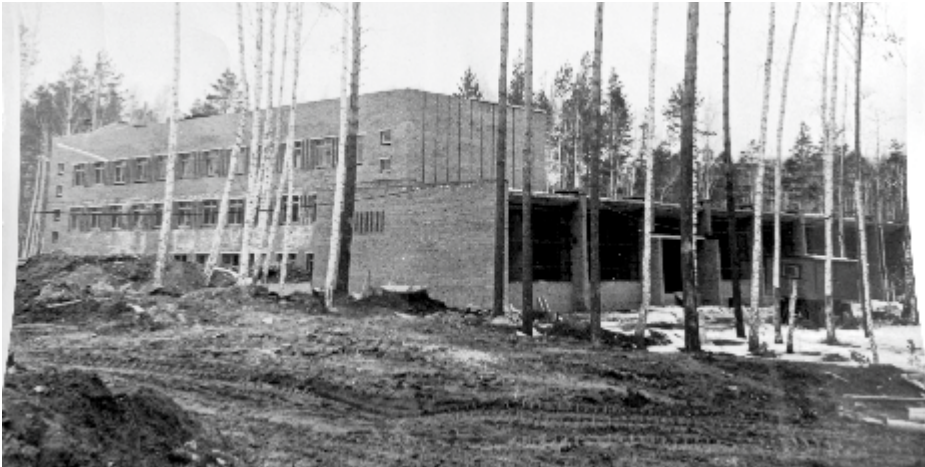
ФОТО ИЗ КОМОДА

Этот исторический снимок запечатлел строительство здания главной почты Заречного.